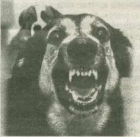
Осторожно: во дворе ... собака!