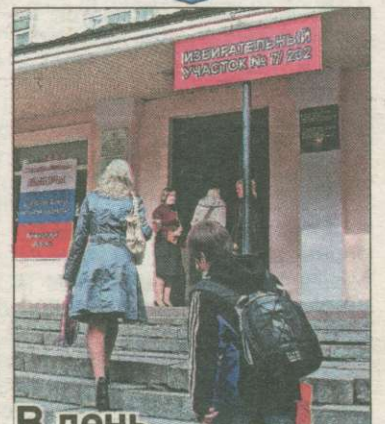
В день голосования