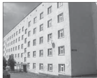
Ул. Нагорная, 1. Общая площадь 30,0 кв.м.