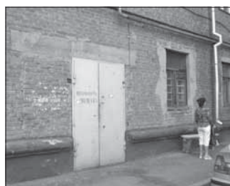
Ул. Весенняя, 13. Общая площадь 173,9 кв.м.