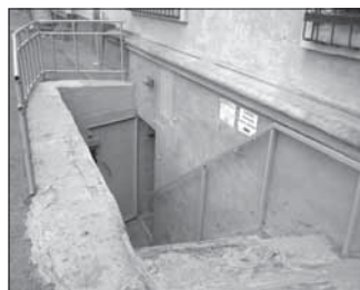
Ул. Островского, 33. Общая площадь 126,5 кв.м.