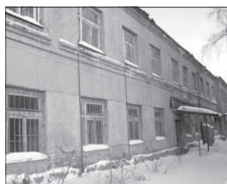
Ул. Профсоюзная, 34 «б». Общая площадь 922,0 кв.м.