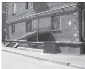
Ул. Весенняя, 16. Общая площадь 98,8 кв.м.