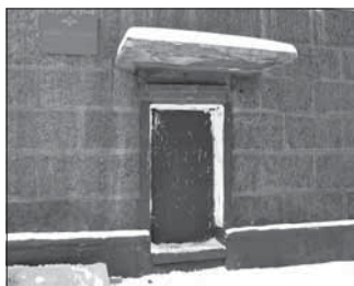
Ул. Островского, 31. Общая площадь 233,8 кв.м.