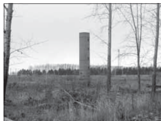
Водонапорная башня (м/у МУЗ «ГКБ № 11» и ул. Вахрушева, 2). Общая площадь 21,2 кв.м.