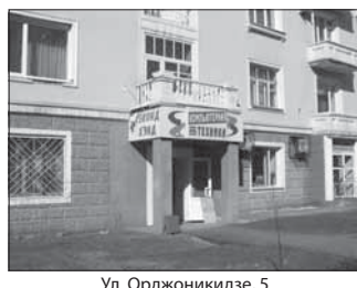
Ул. Орджоникидзе, 5 (магазин непродовольственных товаров). Общая площадь 42,2 кв.м.