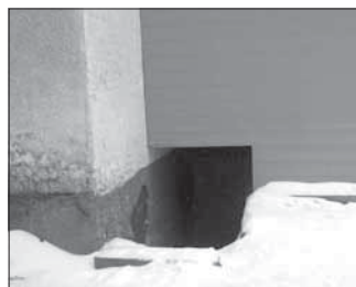
Ул. Патриотов, 36 (склад). Общая площадь 134,4 кв.м.