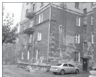
Ул. 40 лет Октября, 20. Общая площадь 161,1 кв.м.