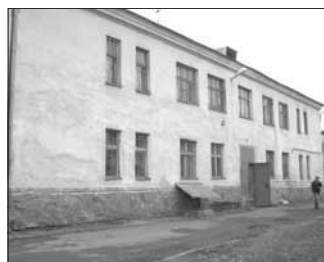
Ул. Каркасная, 10 «а». Общая площадь 155,3 кв.м.