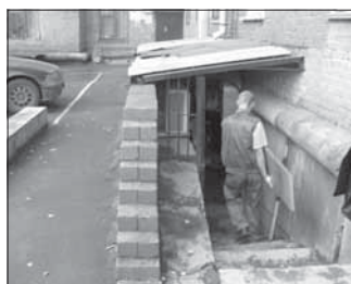
Ул. 50 лет Октября, 15. Общая площадь 133,4 кв.м.