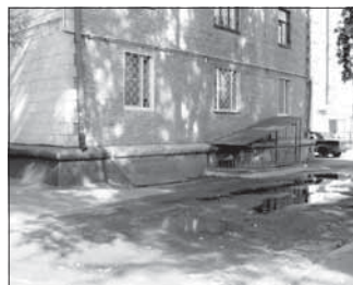
Ул. Весенняя, 22 (склад). Общая площадь 97,8 кв.м.