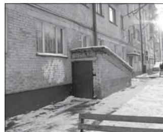
Ул. Волгоградская, 23 (склад). Общая площадь 95,8 кв.м.