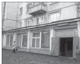
Ул. 40 лет Октября, 8. Общая площадь 284,4 кв.м.