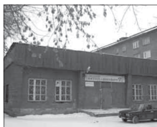
Ул. Рекордная, 2 «а». Общая площадь 371,1 кв.м.