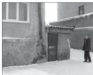
Просп. Октябрьский, 18. Общая площадь 431,2 кв.м.