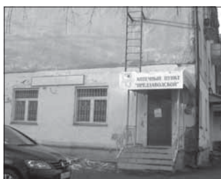
Ул. Предзаводская, 1 «в». Общая площадь 35,1 кв.м.