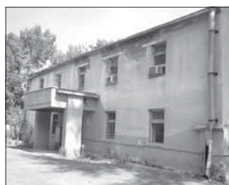
Ул. Ареева, 3. Общая площадь 2209,4 кв.м.