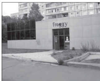
Просп. Ленина, 120. Общая площадь 490,4 кв.м.