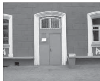
Ул. Островского, 30. Общая площадь 15,8 кв.м.