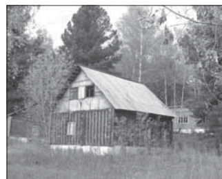
Подъяково, лагерь «Надежда». Общая площадь 1860,0 кв.м.