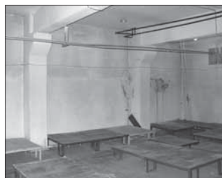
Просп. Ленина, 125 (склад). Общая площадь 498,8 кв.м.