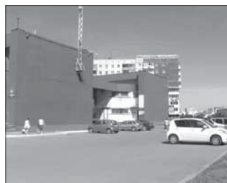
Ул. Марковцева, 20 «б» (чердак). Общая площадь 152,0 кв.м.