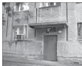
Ул. Сибиряков-гвардейцев, 1. Общая площадь 167,0 кв.м.