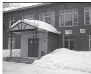
Просп. Ленина, 109 «в». Общая площадь 51,6 кв.м.