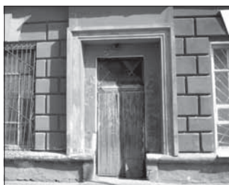
Ул. Ноградская, 8. Общая площадь 220,5 кв.м.