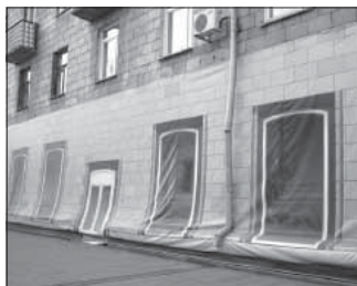
Ул. Весенняя, 21. Общая площадь 300,6 кв.м.