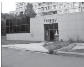
Просп. Ленина, 120. Общая площадь 490,4 кв.м.