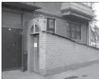
Ул. 50 лет Октября, 22. Общая площадь 207,2 кв.м.