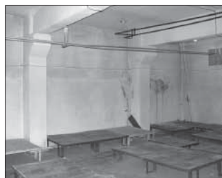
Просп. Ленина, 125 (склад). Общая площадь 498,8 кв.м.