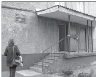
Ул. Институтская, 4. Общая площадь 108,0 кв.м.