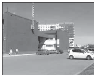
Ул. Марковцева, 20 «б» (чердак). Общая площадь 152,0 кв.м.