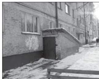
Ул. Волгоградская, 23 (склад). Общая площадь 95,8 кв.м.