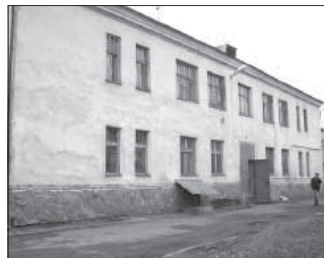
Ул. Каркасная, 10 «а». Общая площадь 155,3 кв.м.