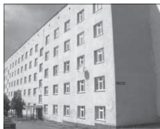
Ул. Нагорная, 1. Общая площадь 30,0 кв.м.