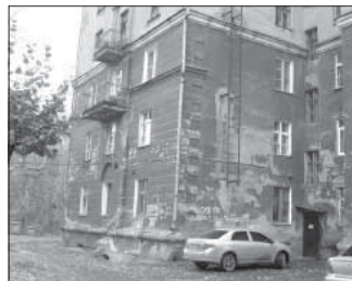
Ул. 40 лет Октября, 20. Общая площадь 161,1 кв.м.