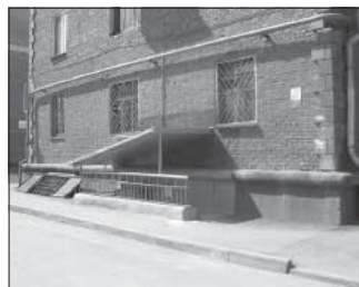
Ул. Весенняя, 16. Общая площадь 98,8 кв.м.