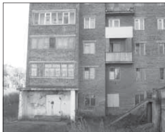
Ул. 1-я Линия, 2. Общая площадь 198,2 кв.м.