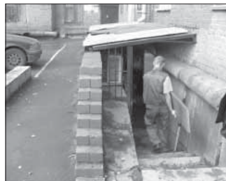
Ул. 50 лет Октября, 15. Общая площадь 133,4 кв.м.