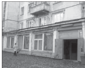
Ул. 40 лет Октября, 8. Общая площадь 284,4 кв.м.