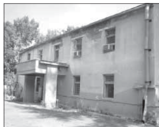
Ул. Агеева, 3. Общая площадь 2209,4 кв.м.