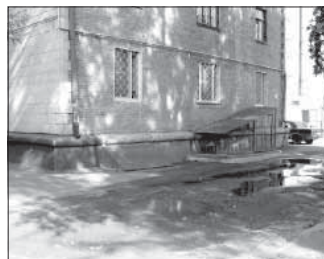
Ул. Весенняя, 22 (склад). Общая площадь 97,8 кв.м.