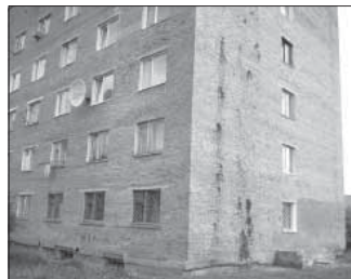
Ул. Космическая, 6. Общая площадь 103,6 кв.м.