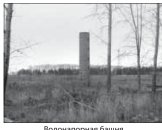
Водонапорная башня (м/у МУЗ «ГКБ № 11» и ул. Вахрушева, 2). Общая площадь 21,2 кв.м.