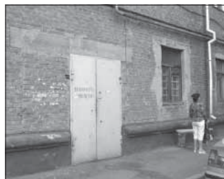
Ул. Весенняя, 13. Общая площадь 173,9 кв.м.