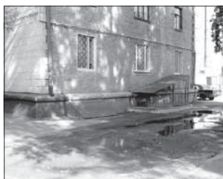
Ул. Весенняя, 22 (склад). Общая площадь 97,8 кв.м.