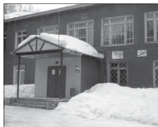
Просп. Ленина, 109 «в». Общая площадь 51,6 кв.м.