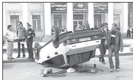
Автоавария произошла на пересечении проспекта Кузнецкого и улицы Коммунистической.

На время проведения работ движение транспорта организовано с учетом интенсивности – в утренние часы пик три полосы открыты для движения в сторону цирка, две полосы – в сторону Ленинского района, а в вечерние часы пик в сторону Ленинского района организовано движение по трем полосам, в сторону цирка – по двум. В остальное время суток движение по двум полосам в каждом направлении.