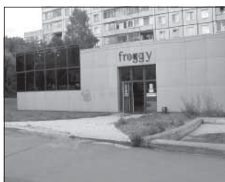
Просп. Ленина, 120. Общая площадь 490,4 кв.м.