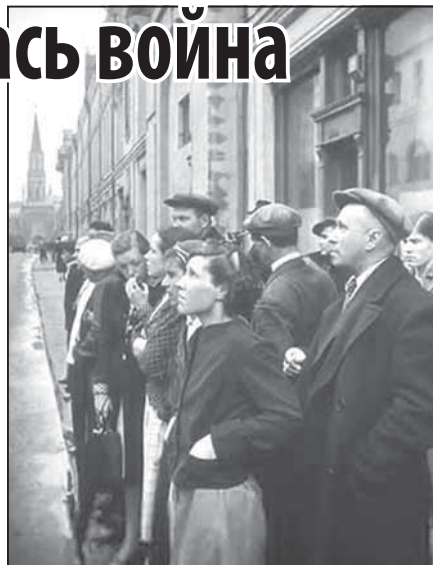
Транслируется речь В.М. Молотова.

Только за один день – 23 июня – на предприятиях и в