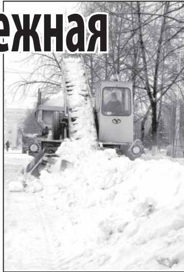
По вопросам зимнего содержания дорог и тротуаров можно обращаться на «горячую линию» МАУ «Кемеровские автодороги» – 64-44-88, 67-00-00, а также на сайт www.kemdor.ru .

Обслуживать магистрали города выходят свыше 200 дорожных рабочих, задействовано 183 единицы техники. Помимо собственных машин, к борьбе со снегом дорожники привлекают технику городских предприятий. На прошлой неделе на магистралях ежедневно работало порядка 50 единиц привлеченной техники – самосвалы, фронтальные погрузчики, бульдозеры, автогрейдеры. С помощью только привлеченной техники в декабре было вывезено 63755 кубометров снега, что составляет примерно 15% от общей массы.