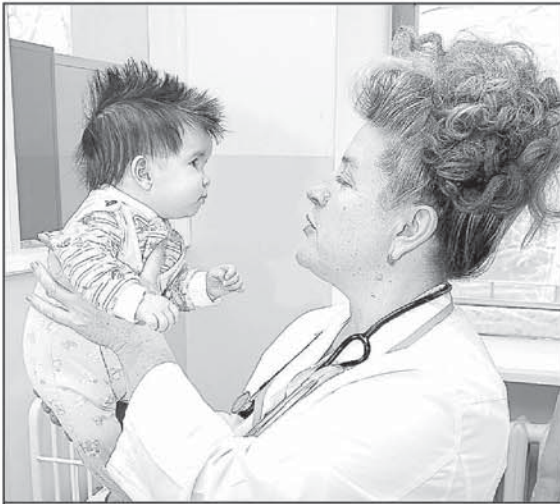
Уровень развития здравоохранения во многом определяет качество жизни горожан.

В числе наиболее актуальных вопросов в здравоохранении на сегодняшний день - работа бригад «Скорой медицинской помощи» (СМП). Ведь от того, насколько быстро врачи придут на вызов, зависит здоровье и жизнь человека. В Кемерове отмечается высокий процент износа санитарного автотранспорта и недостаточное развитие ремонтной базы. В связи с этим инициативной группой было предложено разработать план мероприятий по повышению эффективности деятельности СМП до 2013 года, который включает: