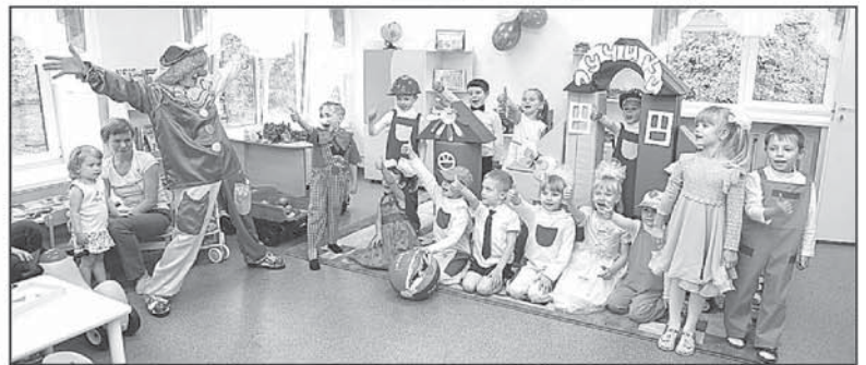
В первом квартале 2011 года в городе будет открыто 500 новых дошкольных мест.

Не последнее место в числе обращений занимают вопросы, связанные с образованием: правила приема в общеобразовательные учреждения, ремонт системы отопления в дошкольных учреждениях, зачисление ребенка в детский сад, организация школьного питания, проведение ремонта в школьной столовой. Большое внимание участники инициативной группы уделяют вопросам дошкольного образования. Так, до конца марта в городе будет дополнительно открыто 366 мест в дошкольных учреждениях, всего же в I квартале будет открыто 500 мест.