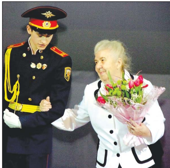
В филармонии Кузбасса прошла церемония награждения победительниц городского конкурса «Кемеровчанка года».