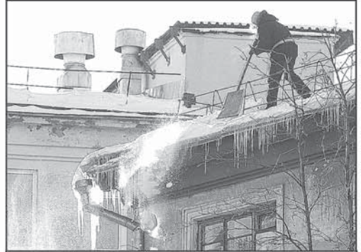
Сегодня вопросы по очистке крыш и уборке дворовых территорий решаются оперативно.

Кстати, вопросов возникает меньше, когда показания счетчиков передаются вовремя - в этом убедились многие жители города. Тем не менее более чем в 200 случаях проверка показала некорректность расчетов, что послужило поводом для работы инициативной группы. Если будут доказаны несоответствия, то управляющая компания обязана будет произвести перерасчет.