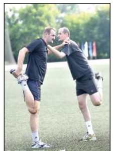
ВК «Кузбасс» вышел из лета