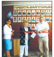
Дворик под крышей