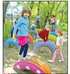
Место для малыша