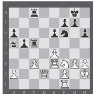
Диаграмма № 3