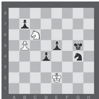
Диаграмма № 2