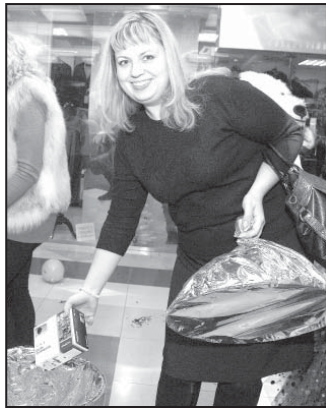
ми воспитанниками детских домов. К шарам и гирляндам