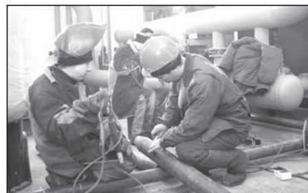
Идет монтаж новой котельной.