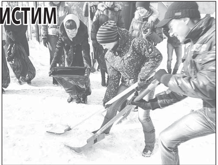
В ходе акции «Стол заказов» телеканала «Мой город» и администрации города журналисты провели субботник сами, а потом помогли в уборке жителям двух микрорайонов.

Сотрудники жилищно-эксплуатационных организаций призывают горожан не парковать личный автотранспорт в непосредственной близости от многоэтажных зданий, так как это затрудняет работу коммунальщиков. Следует соблюдать и меры личной предосторожности, обходя места возможного схода снега и падения сосулек. А при выявлении опасных участков немедленно сообщать в управляющую организацию, в случае неприятных мер – на «горячую линию» «Жилкомцентра» по тел. 31-23-32, ежедневно с 8.00 до 20.00.