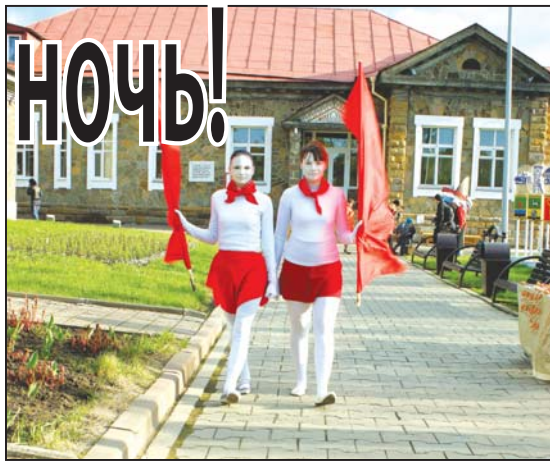
В музее-заповеднике «Красная Горка» прошла музейная ночь. На этот раз на территории музея организовали грандиозные народные гуляния в традициях советских парков культуры и отдыха.

«Красная Горка» принимает участие во всероссийской акции «Ночь в музее» в третий раз. Каждый год тематика мероприятия разная. В этом году его решили посвятить 80-летию переименования Щегловска в Кемерово и 80-летию Рудничного района. Первые посетители начали собираться еще за светом. На входе их приветствовали статуи пионеров – точно таких, что стояли в советские времена в парках. Белые фигуры в красных галстуках, со знаменами смотрелись очень эффектно. Они замирали на своих постамах, а потом вдруг оживали и меняли позы. Для детей музей выделил спортивную площадку, где можно было попробовать передвигаться на ходулях, поиграть в городки и домино.