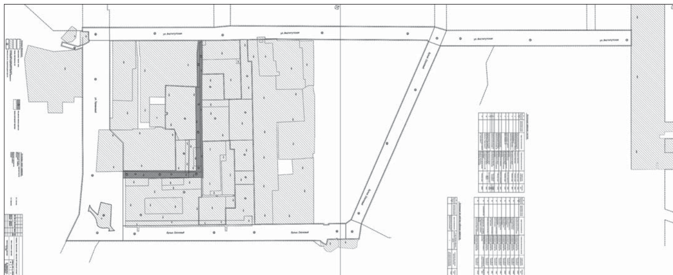
Приложение № 3