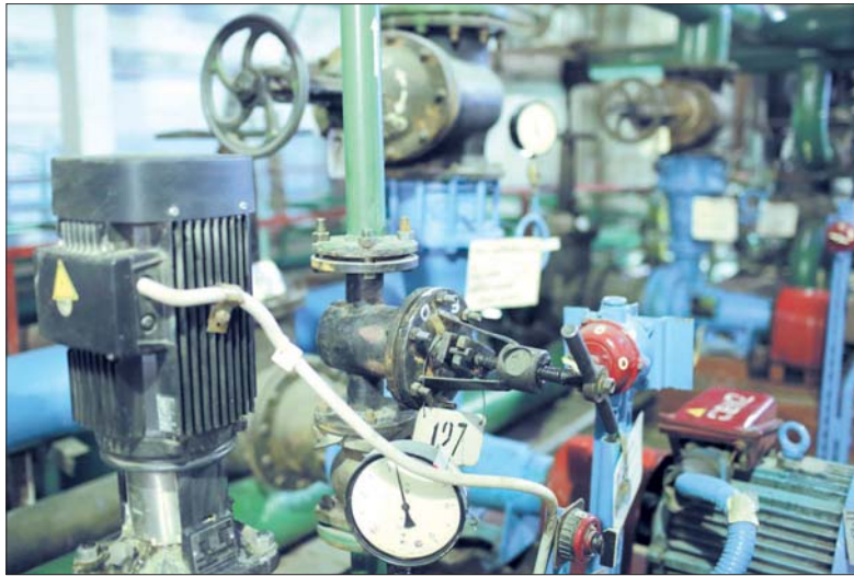
График запуска тепла по районам размещен на официальном сайте администрации города: www.kemerovo.ru/glavnoe/nachalo_otopitelnogo_sezona.html .

Специалистами «Водоканала» выполнены капитальный ремонт и реконструкция 11,63 километра водопроводных сетей, а также 3,88 километра сетей водоотведения. Кроме этого, установлен новый канализационный коллектор на проспекте Кузнецком, в домах № 135