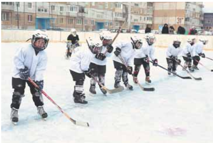
На фото: «Тигрята» вырастают в «Тигров»...