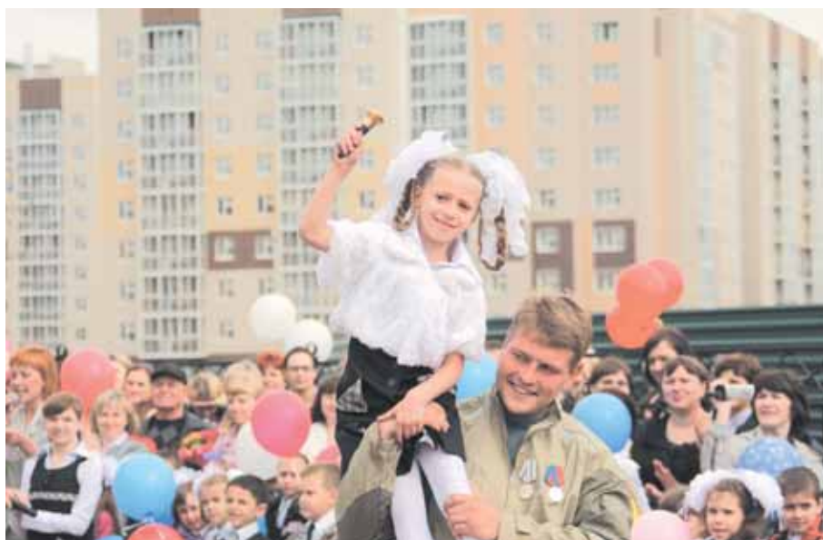
На фото: в 2013 году распахнула свои двери уже третья по счету «цифровая» школа – № 36 в Рудничном районе города, в центре строящегося микрорайона.