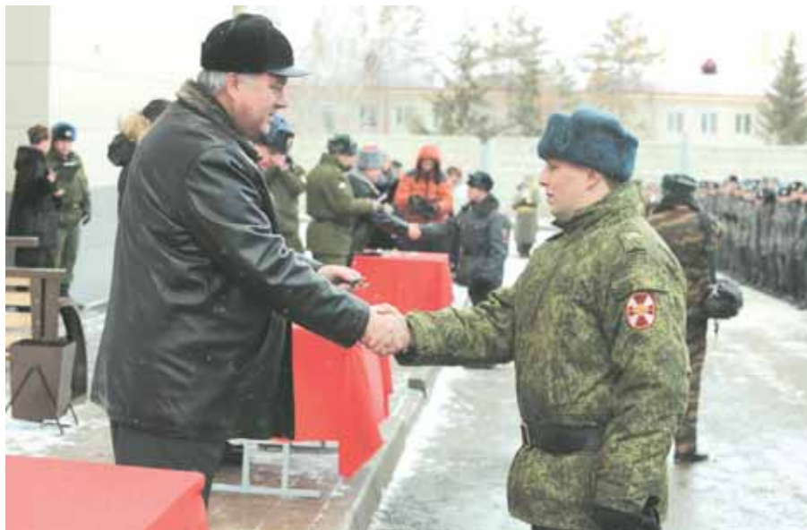
На фото: в декабре ключи от новых квартир получили военнослужащие войсковой части № 6607 в микрорайоне Южный. Этого события они ждали многие годы.

Среди открытых в 2013 году после капитального ремонта медицинских учреждений – женская консультация № 2 МБУЗ «Клиническая поликлиника № 5» (бульвар Строителей), женская консультация поликлиники № 6 (микрорайон Южный), гинекологическое отделение ГКБ № 11 (Рудничный район), общая врачебная практика (проспект Комсомольский), цифровая поликлиника (проспект Московский), родильный дом ГКБ № 2 (Кировский район), бактериологическая лаборатория и стационар ДКБ № 7 (Центральный район), педиатрическое отделение острых респираторных вирусных инфекций ГКБ № 2 (Кировский район).