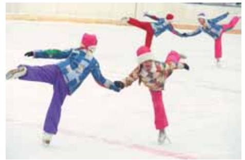
На фото: поддержка от фигурного катания. На льду фигуристики ДЮСШ № 6.