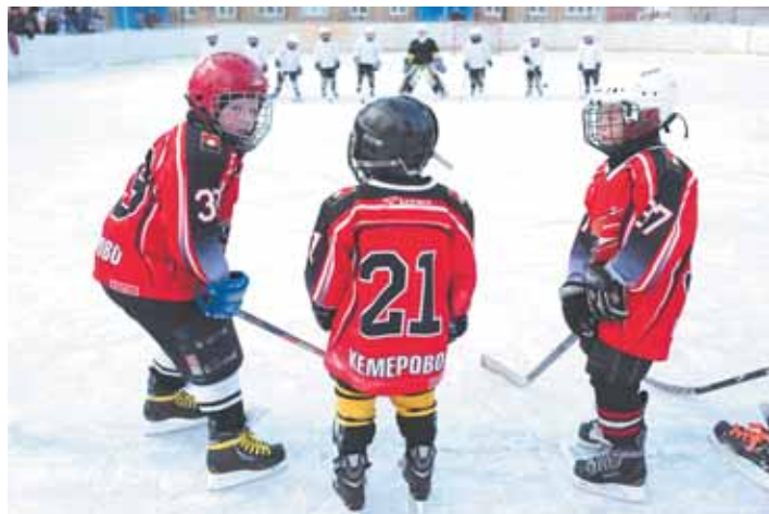
На фото: сейчас будет финал.

А финал превзошёл все ожидания. Приписываем к нему и слово «супер», несмотря на возраст участников. Впрочем, для всех ребят наши «Шайбу! Шайбу!» пока самые значимые соревнования. К тому же, воспользовавшись тем, что мы не стали «утяжелять» регламент различными ограничениями, «Тигрята» на второй