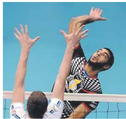
На фото: Эрвин Нгапет теперь будет бить по мячу не в Кемерово.