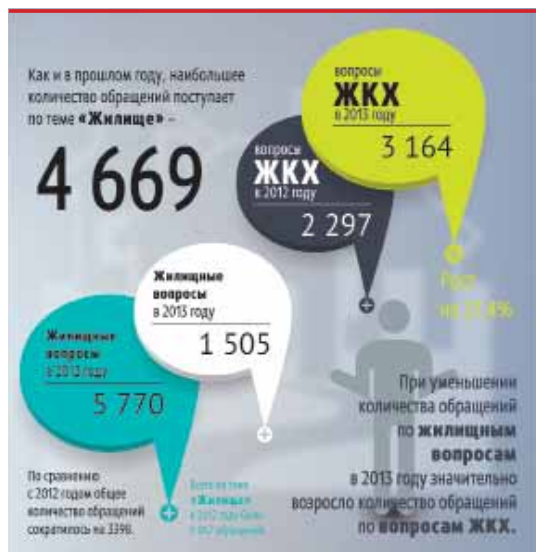
Рис. 2. Обращения граждан по теме «Жилище»