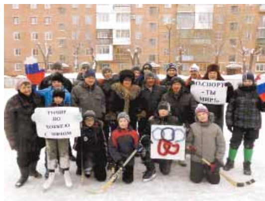
На фото: хоккей на валенках (ЦРН «Единство»).