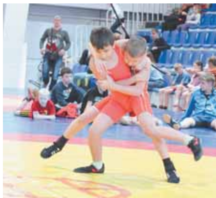
На фото: у вольной борьбы не одна пара рук и ног...

Конечно, никто из тренеров не ставил цель своим воспитанникам во что бы то ни стало занять призовое место. Главной задачей наставников и традиционного турнира было проверить, как у юных борцов закрепились технические навыки, полученные в процессе длительных тренировок, как их воспитанники умеют не только побеждать, но и достойно проигрывать. Ну и, конечно, по-борцовски, на ковре отметить Новый год. □