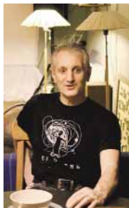
На фото: после спектакля