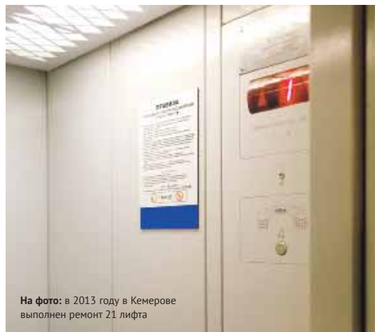
На фото: в 2013 году в Кемерово выполнен ремонт 21 лифта