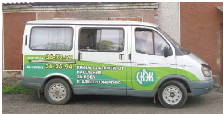
На фото: платежи от населения принимаются в таких передвижных кассах

При этом «специалисты» никак не представляются, не предъявляют документов. Уже пятеро доверчивых горожан заплатили непонятым людям по 500 рублей – якобы за нарушенную пломбу и новую опломбировку. Мы обратились в Северо-Кузбасскую энергетическую компанию с просьбой прокомментировать ситуацию. Вот что нам ответили: