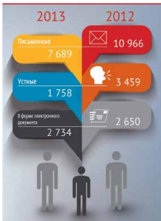
Рис. 1. Общее количество обращений граждан в администрацию г. Кемерово