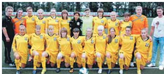
На фото: команда футбольного клуба «Кузбасс».

Уважаемые горожане – любители футбола! Знакомим вас с главными успехами ФК «Кузбасс» в сезоне 2013 года, которые свершились благодаря общим усилиям всех людей, вовлечённых в процесс деятельности клуба.