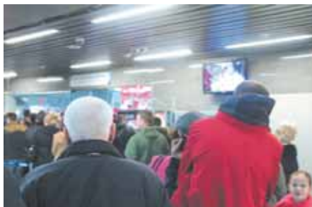
На фото: досмотр – на досмотр: почти скрытой камерой (на самом пункте снимать нельзя).

вообще не приезжать на такие соревнования: современные технологии дают куда больше воз-