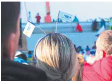
На фото: болельщик существо чуткое, как мотылек.