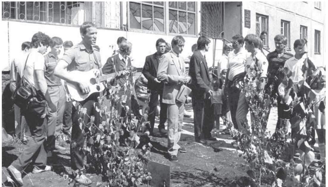
На фото: открытие видеокэфе «Асқар», организованного «афганцами».

Необходимо отметить, что в первые годы Афганской войны кемеровчане, как и все советские люди, были плохо осведомлены о причинах ввода наших войск на территорию этой страны. Эта война долгое время оставалась закрытой для печати темой, плохо известной в обществе. Власть старалась представить «интернациональную помощь» ограниченного контингента советских войск исключительно гуманитарной. Газеты тогда писали об аллахх дружбы, о строительстве школ и больниц, доставке грузов братскому афганскому народу, о том, как советские врачи принимали роды у афганских женщин.