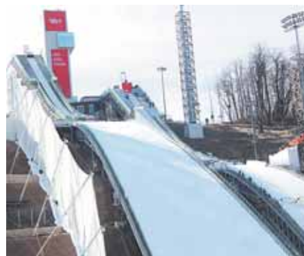
На фото: вот они, «Русские горки»!