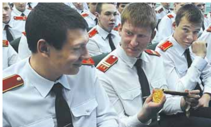
На фото: золотую олимпийскую медаль можно было подержать в руках; кстати, сам олимпийский чемпион утверждает, что она счастливая.

В течение последних месяцев шести в учебных заведениях городов Кузбасса, в том числе в Кемерово, прошло множество Уроков спорта, на которых школьники общались с известными спортсменами. В день начала соревнований Сочинской олимпиады (6 февраля) состоялась такая встреча и в Кемеровской областной кадетской школе-интернате полиции (ОКШИП).