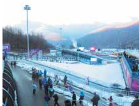
На фото: «Санки» за рамки: как ни старался санный стадион, в один кадр не помещается.