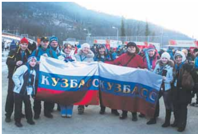
На фото: наши на «Санках»: часть кузбасской делегации перед входом на санный стадион.