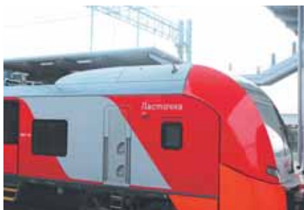
На фото: трудолюбивая «Ласточка».