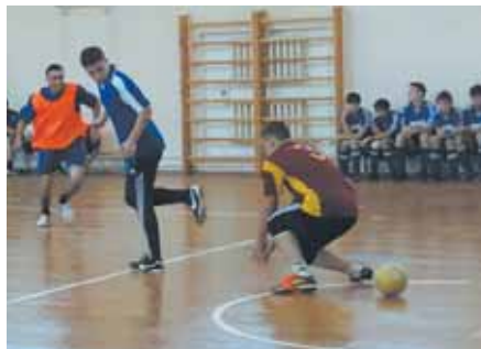
На фото: команда школы № 31 в матче с «Мечтой» показала красивый футбол с элементами филигранной техники – например, вот такой гол между ног вратаря после удара пяткой, однако в игре порядка очень часто бьёт класс, а потому победила всё-таки «Мечта» – 7:6.

В общем же такое минимальное преимущество показательно. До последнего тура напряжённая борьба за лидерство первенства не давала возможности даже приблизительно предсказать не только чемпиона, но даже призовую тройку. Так, победившая в первом матче последнего тура «Мечта» (тренер – И.Ю. Смирнов) могла быть уверена лишь в том, что будет в призовой тройке, но вот на каком именно месте – зависело от оставшихся двух матчей тура.