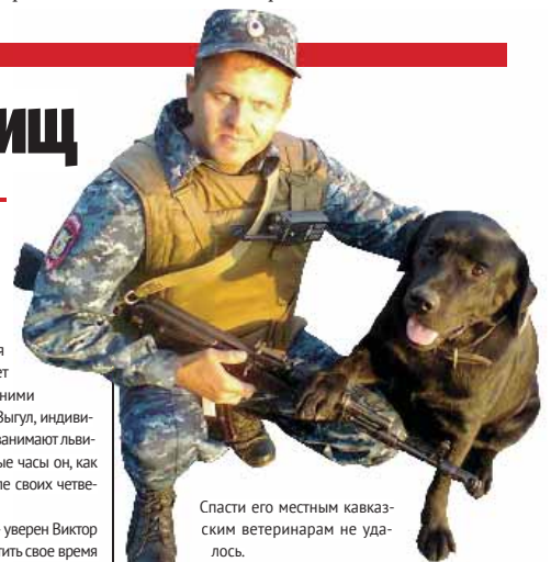
Спаси его местным кавказским ветеринаром не удалось.

К сожалению, из служебной командировки домой вернулся лишь один из кемеровских пушистых бойцов – «немка» Дерби. Умница, талант и настоящий любимец всего отряда лабрадор Максдар умер от укуса клеща.