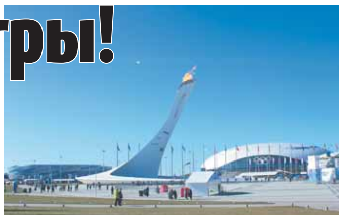
На фото: «Олимпик Плаза» в хоккейном «интерьере» беспарашной «Шайбы» (слева) и претенциозного «Большого» (справа).