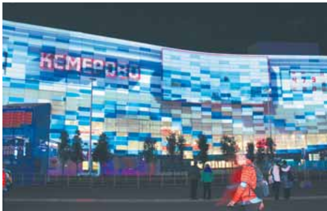
На фото: Кемерово на «Айсберге».

Воспитанник новокузнецкого хоккея голкипер Сергей Бобровский стал героем матча Россия – США, который россияне проиграли только по буллитам, а также отстоял «на ноль» в четвертьфинальном матче с норвежцами – 4:0.