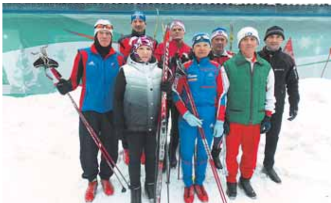
На фото: ветераны динамовцы – чемпионы, призёры российских, областных и городских соревнований.

Женщины также отличились, завоевав командный кубок, но при равном количестве очков (по 12) с командой Ленинск-Кузнецкого района. □