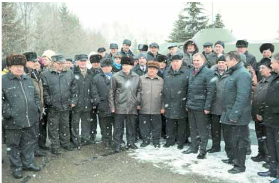
На фото: участники событий на Даманском у закладного камня памятнику воинам-пограничникам в парке им. Жукова.

– Я был в солдатской гуще, в этой среде, – вспо-