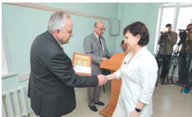
На фото: глава города вручил награды медицинским работникам, выполнившим операцию по трансплантации.