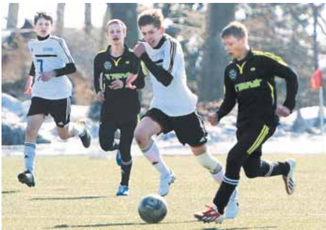
На фото: «Тюмень» (в белых футболках) была чуть лучше кемеровской СДЮСШОР.