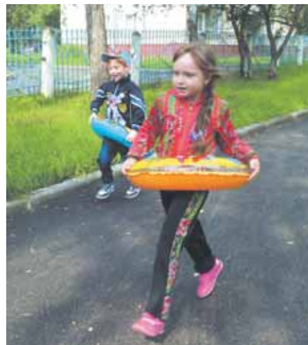
На фото: для малышей дорога к спорту начинается с «Весёлых стартов».