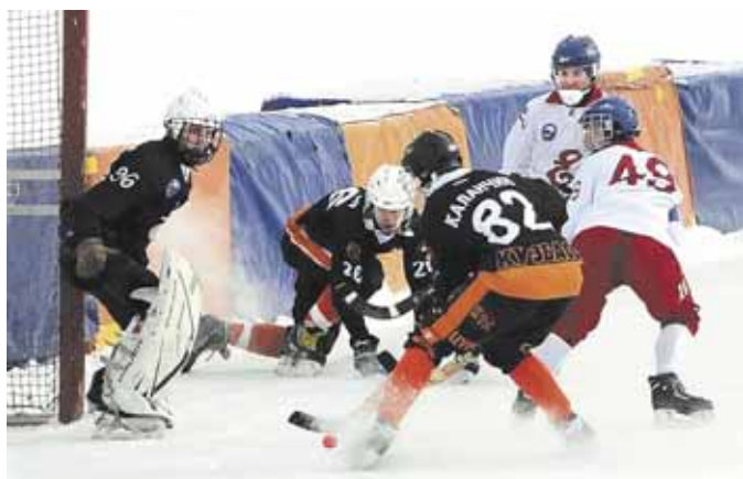
На фото: в этом февральском матче «Кузбасс-2» проиграл, но позавчера взял реванш у «Енисей-2».

В результате четвертьфинальные пары получились такими: КузГТУ – РГТЭУ, КузГТУ-2 – КемГУ, КемГУКИ – «РиалТЭК», «Кедровка» – ДЮСШ № 2. Победители этих матчей, собственно, и станут «депутатами» от «севера». ☑