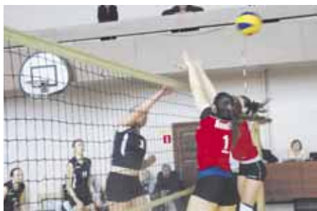
На фото: КемГУКИ – СибГИУ.

Надо сказать, и у КемГУ не осталась незамеченной лучшая волейболистка команды. Специальный приз получила Евгения Немцева.