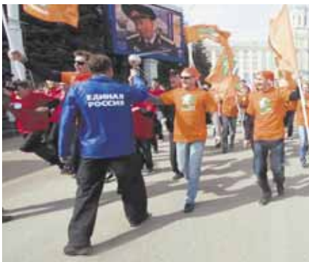
На фото: так закончился первый «полёт»...

на улице Весенней в нашем городе состоится, по сути, старт федерального проекта «Беги за мной», направленного на привлечение россиян к здоровому образу жизни вообще и к оздоровительному бегу в частности. У памятника Леонову также впервые состоится молодёжный флэш-моб. ☑