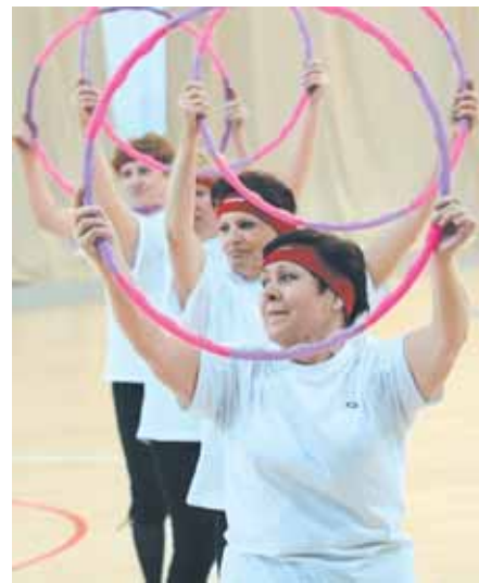
На фото: в гимнастическом турнире побеждают все!