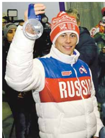
На фото: серебряная медаль — высшее достижение кузбасского спорта на зимних Олимпиадах.