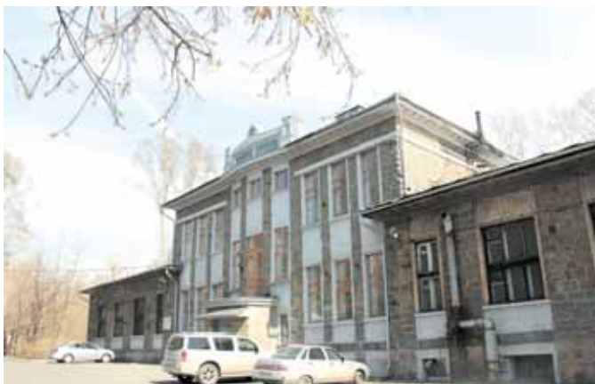
На фото: первое каменное здание города Кемерово, постройка 1916 года.

Разумеется, охватить Кемерово за один день невозможно, и экспедиция по областному центру будет продолжена. ☑ Беседовала Ольга ТИТОВИЧ.