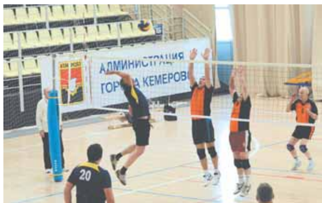
На фото: в каждом матче – «душевный» волейбол.

Специальными кубками и грамотами были награждены: Центральный район – за наибольшее количество призовых мест, Заводский район – за активность и массовость, Рудничный – за привлечение к занятиям физической культурой большего количества ветеранов старше 70 лет, Кировский район – за массовые мероприятия.