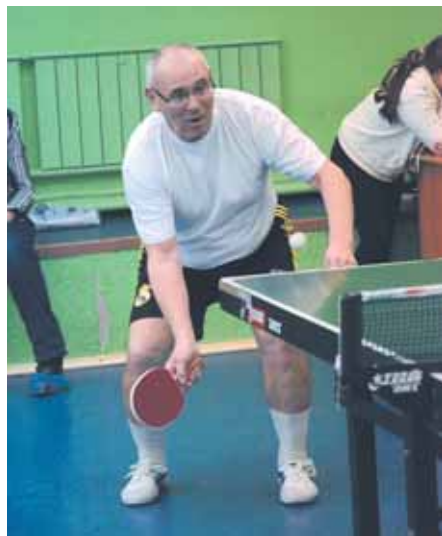
На фото: ветеранский теннис – спор опытных.