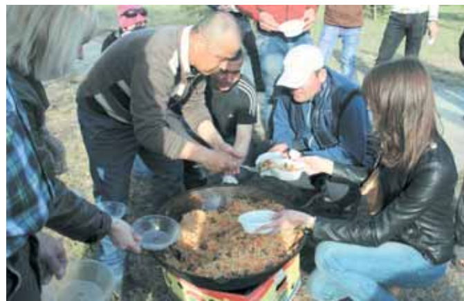
На фото: после хорошей работы – узбекский плов.