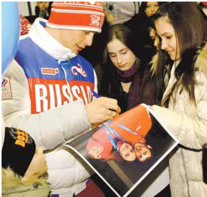
На фото: «Куда ни приду, почти везде узнают...»

— Когда пришло понимание, что у тебя в лыжах всё получается и что надо