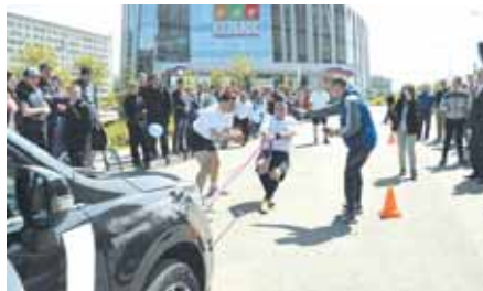
На фото: экологически чистый двигатель команды «Кросс-фит 42».

Текст: Сергей СОСЕДОВ.