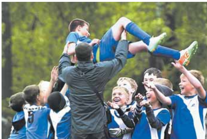
На фото: «зенитовец» в зените.

А вот мальчикам пришлось пострадать. Ареной для этого у самых младших и старших стал