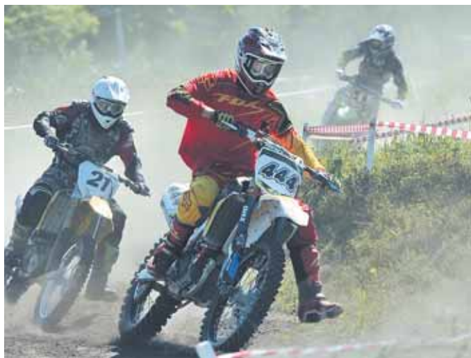
На фото: чемпион ещё не завершил гонку, а в его глазах даже из-под шлема виден чёткий путь к победе.