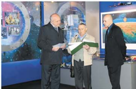
Новый фотоальбом передан в музей космонавтики имени Алексея Леонова.

По словам ветерана, космонавтов и кузбасских лесоводов связывает прекрасная традиция создания памятных посадок в честь достижений в космосе. Так, помимо парка в Листвянке были созданы памятные по-