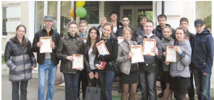
Участники XI областного слета юных экологов в Кемерове.

А на территории самой станции произрастает 370