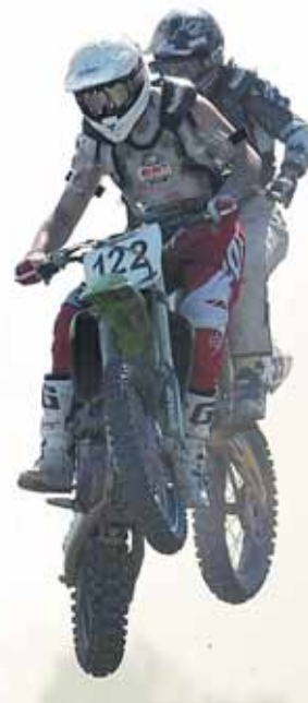
На фото: «Боливар» не вытянет двоих?