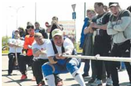
На фото: «Тухачевские» вытягивают победу.