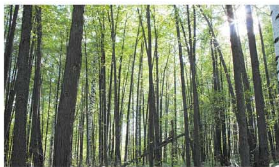
Липовый остров в Новокузнецком районе.