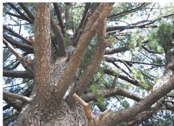
Кедр в г. Березовском – первый в Сибири памятник живой природы.

Департамент лесного комплекса предлагает жителям области направлять свои предложения по растению – символу Кузбасса на электронный адрес департамента dlk@kemles.ru или на почтовый адрес: 650036, г. Кемерово, ул. Мирная, 5 , с пометкой «Символ Кузбасса».