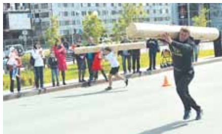
На фото: брёвна для разминки.