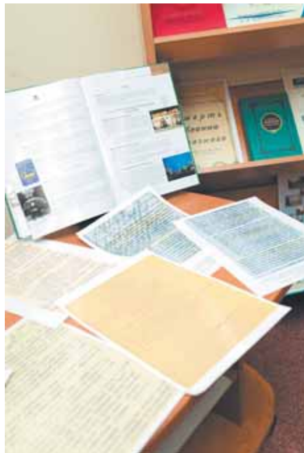
На фото: экспозиция «Театр без границ» в библиотеке «Диалог».

С 1 января 1937 года театр перешёл на хозрасчёт. Было принято соотношение постановочное городскому Совету. Некоторое время театр именовался «Культармеец Кузбасса». В постановлении говорится, что такое название в духу времени не соответствует и на вывеске следует написать «Кемеровский Городской театр». Документом, датированным 37-м годом, утверждался репертуар: «Пиковая дама» Пушкина, «Разбойники» Шиллера, «Бесприданница» Островского, «Анна Каренина» Толстого. В одной ком-