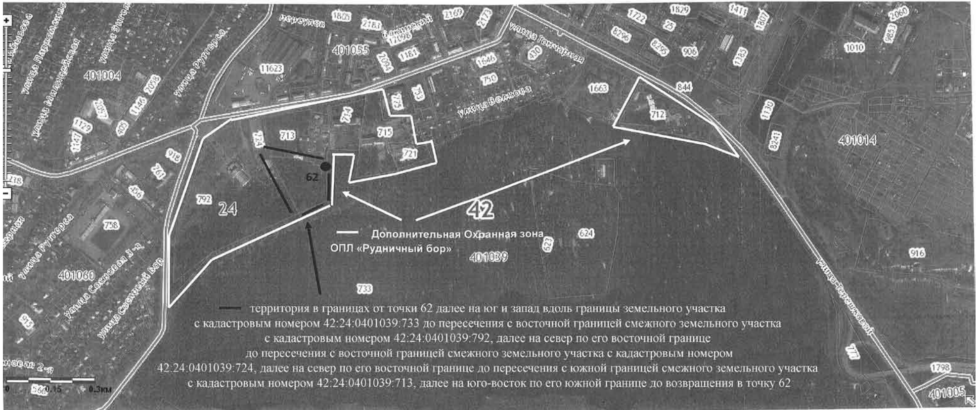
Схема расположения земельных участков, которые необходимо дополнительно включить в Охранную зону ОПЛ «Рудничный бор»