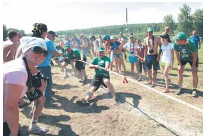
На фото: перетягивание каната.