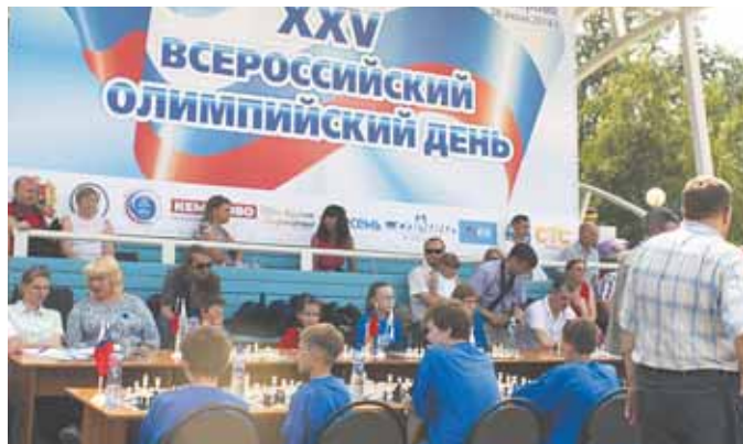
На фото: шахматы – олимпийские по духу.