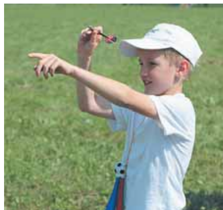
На фото: точно в цель!