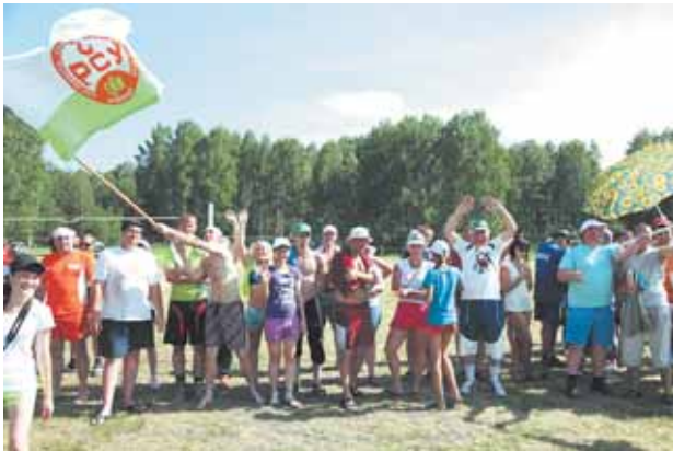
На фото: главное - вместе!

Б аза отдыха «Берёзовый уют» в деревне Калинкино уже не первый год становится в летние месяцы большой спортивной ареной. Вдоль двух живописных прудов расположились волейбольные площадки, два футбольных поля, поляна для семейных стартов и перетягивания каната. Ближе к судейской палатке установили дартс. Так в минувшие выходные проходила спартакиада предприятий Северо-Кузбасской энергетической компании.