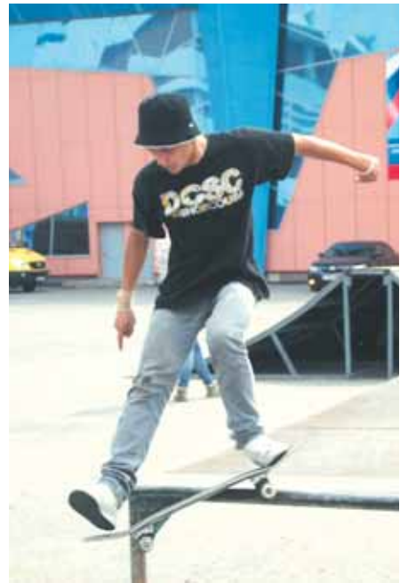
На фото: неукротимый скейт.