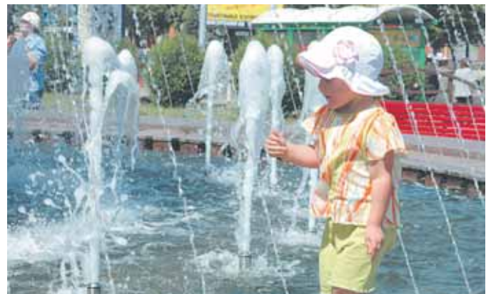
На фото: фонтан у драмтеатра; здесь могут «водиться» будущие чемпионки Европы.