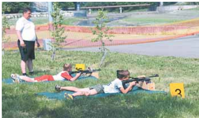
На фото: ни одна мишень не пострадала – биатлон лазерный.