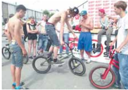
На фото: ближе к жюри – выше оценка?

Сначала участники показывали всё, на что способны, на одной фигуре, затем на другой, на третьей... И в каждой дисциплине были свои победители и призы от спонсоров. Судили участников, кстати сказать, довольно субъективно: жюри оценивало, нравится или нет выполненный трюк, а также имели значение одобрительные выкрики зрителей. Однако, несмотря на эту субъективность, большинство осталось довольно мероприятием. К