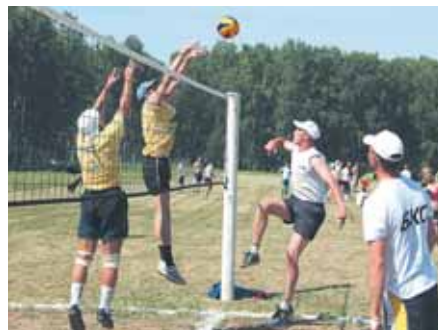
На фото: в жёлтых майках команда Ленинск-Кузнецкой электросети.