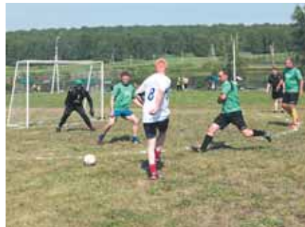
На фото: только вперёд, только победа!

12 килограммов выловленной рыбы, 400 человек – участники и болельщики, температура воздуха +35 градусов. Вот такая «спортивная математика»!