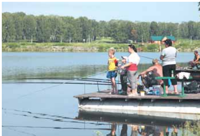
На фото: в СКЭК рыбачат все: и взрослые, и дети.

эстафете и оказались самыми сильными, выиграв соревнования по перетягиванию каната.