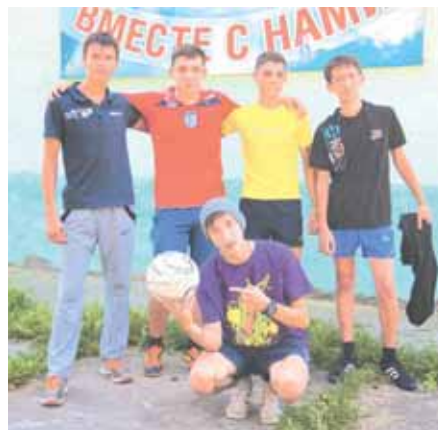
На фото: футбольная команда РБС.

А в 14-30 начинается КТД, о котором говорил участник клуба тележур-