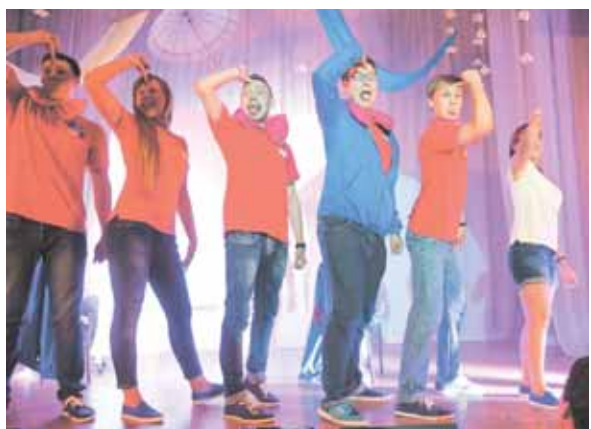
На фото: фрагмент комиссарского шоу.