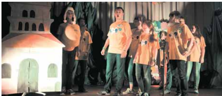
На фото: КТД «Мы из Кузбасса». Презентация Кузнецкой крепости.