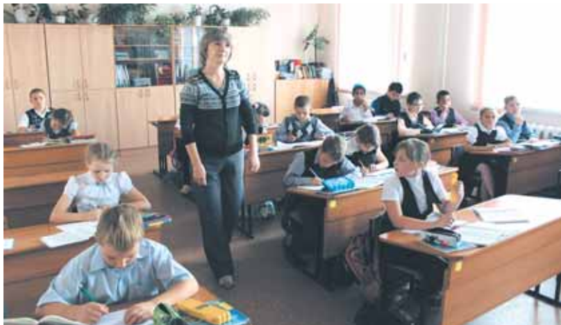
На фото: многие педагоги 65-й – выпускники этой школы.

О школах, расположенных в центре города, СМИ пишут гораздо чаще, чем о тех, которые находятся в отдалённых районах. Накануне профессионального праздника педагогов мы решили исправить этот перекос. Отправились в заводской район, в школу № 65, которая в этом году отмечает некруглый, но юбилей: первых учеников она приняла в 1959-м.