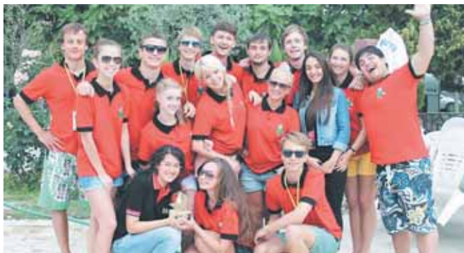
На фото: «Карман» – победитель Международного фестиваля любительских театров (Турция, 2013 год).

Театр «Карман» КузГТУ, лауреат премии «Молодость Кузбасса», обладатель десятка Гран-при и полсотни дипломов различных фестивалей всех уровней, отметил 10-летний юбилей.