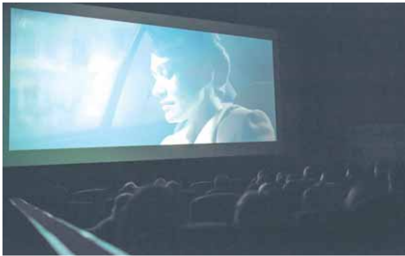
На фото: официальная премьера кемеровского фильма «Зоиин день» на фестивале «Видение».

Подведены итоги фестиваля авторского короткометражного кино «Видение», состоявшегося в Кемерове в восьмой раз. Показы – конкурсные и «бонусные» – продолжались целых семь дней. В программе – короткометражки, снятые как любителями, так и студентами творческих вузов.