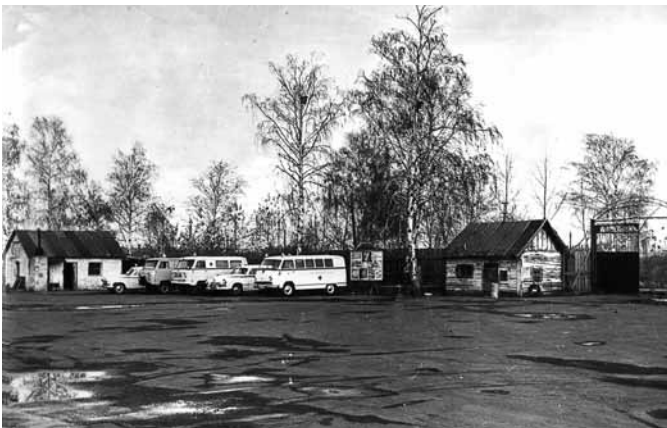
На фото: автомобили «скорой помощи», 1965 год.