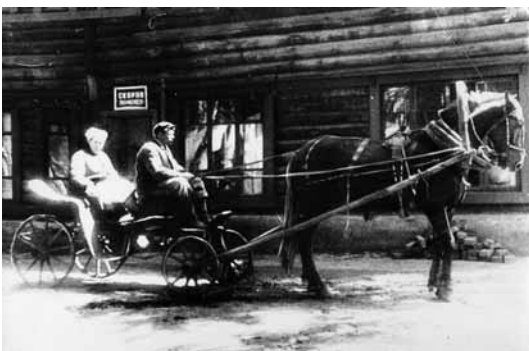
На фото: карета «скорой помощи» готова к выезду, 1935 год.

Теперь Кемеровская станция скорой медицинской помощи – крупная медицинская организация, имеющая в структуре три подстанции: Главную (ул. Волгоградская, 39), Центральную (ул. Н. Островского, 24) и Правобережную (ул. Рутгерса, 39«а»), два поста (в пос. Южный и в жилом районе Кедровка). Это крупное лечебное учреждение, предназначенное оказывать экстренную медицинскую помощь на догоспитальном этапе жителям г. Кемерово и Кемеровского района общей численностью около 600 тысяч человек и с числом вызовов в год в среднем 180-190 тысяч. Это 48 круглосуточных оперативных бригад разного профиля. Это 30 тысяч телефонных консультаций в год. ☑