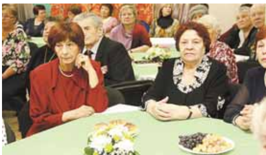
На фото: пятая часть кемеровчан – пенсионеры.

День пожилых людей в Кузбассе отмечали как День уважения к старшему поколению. В Кемерове мероприятия, посвящённые этому празднику, прошли во всех районах города.