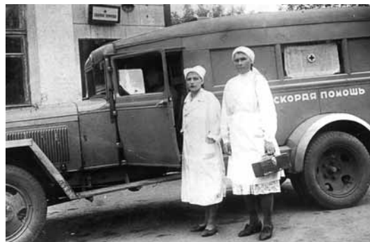
На фото: грузовик, переоборудованный в фургон «скорой помощи», 1958 год.

В 1938 году отделение реорганизовано в самостоятельное учреждение – станцию «Скорой медицинской помощи». Располагалась она в одноэтажном деревянном здании на месте, где теперь находится роддом № 1. Штат сотрудников состоял из 10 врачей-совместителей, 5 медицинских сестер и 4 санита-