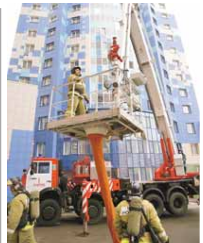
На фото: пожарные спасут, но не застрахуют...

Страхование общедомового имущества – это новое направление в нашей совместной работе со страховыми компаниями. – Как это работает? – Управляющей компании необходимо провести собрание собственников жилья многоквартирного дома по вопросу страхования общедомового