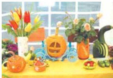
На фото: «Огородное чудо».