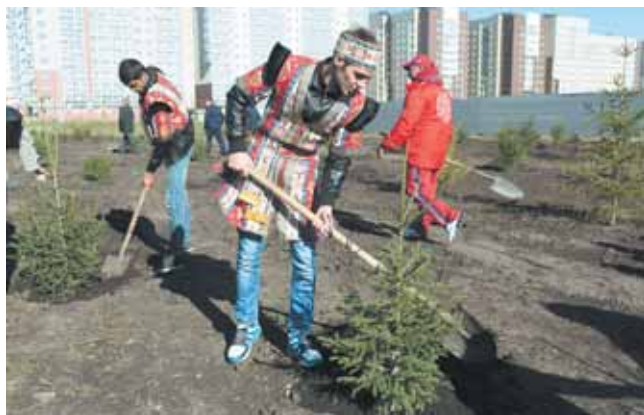
На фото: на аллее Дружбы народов (рядом с ТЦ «Север») работали люди разных национальностей.