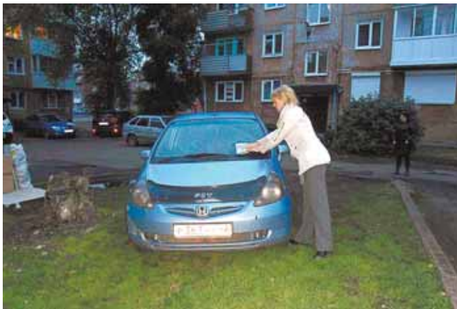
На фото: за такую «парковку» придется отвечать.

Контроль со стороны административных комиссий за неправильно припаркованными автомобилями во дворах жилых многоквартирных домов продолжается.