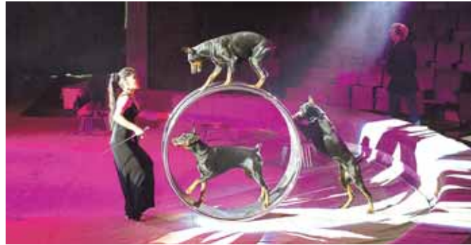
На фото: доберманы! И в ансамбле?!

В другом номере на арену выходят звери, которых принято называть хозяевами тайги. Как объявила ведущая, «самые юные участники представления». В моем детстве козалапы, работавшие в цирке, поражали публику умением кататься на велосипедах и мотоциклах. В двадцать первом веке освоили скейт. Ездят на нём даже парами – повернувшись друг