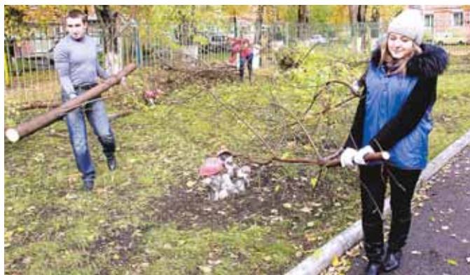
На фото: субботник на территории детского сада № 89 лишь один из многих.

Весело и многолюдно было с утра 8 октября и на территории детского сада № 89 в Центральном районе города. Но вместо малышей на детской площадке собрались старшеклассники, студенты и взрослые. Сотрудники территориального управления Центрального района, центра детского творчества имени Веры Волошиной и ДОУ