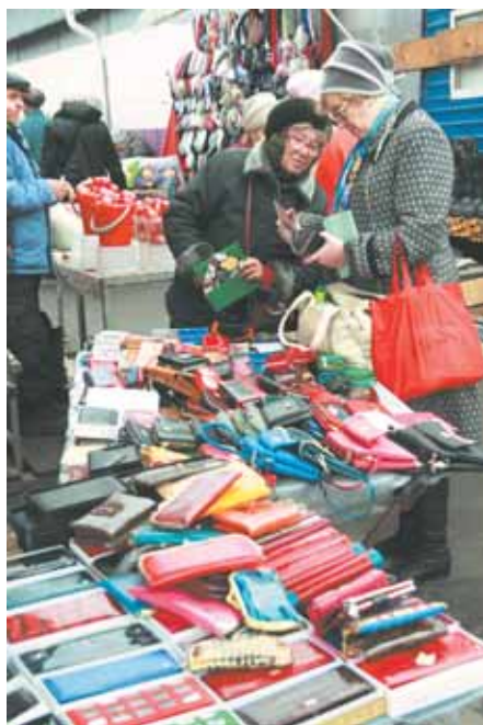
На фото: ассортимент широк, в цивилизованном бы месте...

Всего за время рейда было составлено три протокола об административном правонарушении, предусмотренном ст. 34 Закона Кемеровской области от 16 июня 2006 г. № 89-ОЗ «Об административных правонарушениях в Кемеровской области». За торговлю товарами в неустановленных местах предпринимателям придется заплатить штраф в размере от 100 до 2500 рублей. □