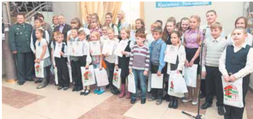
На фото: лауреаты «Книжной Вселенной».

В Театре для детей и молодежи состоялся традиционный праздник подведения итогов программы летних чтений «Летние звезды книжной Вселенной», организованный МАУК «Муниципальная информационно-библиотечная система» города Кемерово.