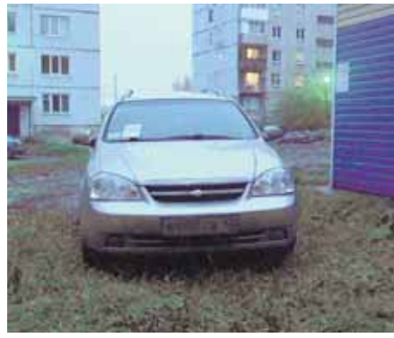
На фото: административное правонарушение – парковка на газоне.

Всего за час работы зафиксировано 187 нарушений. □