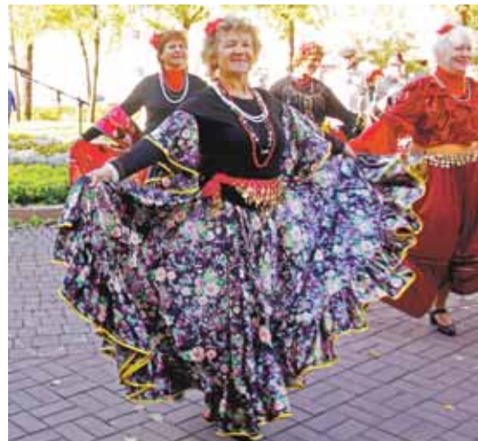
На фото: Арбат на Весенней.

Зажигательные испанские и цыганские танцы, энергичный мастер-класс по модной скандинавской ходьбе, увлекательные уроки карвинга и конкурс туристической песни... Всё это и многое другое можно было увидеть в исполнении кемеровских пенсионеров накануне Дня пожилых людей на улице Весенней областного центра.