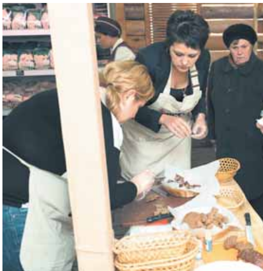
На фото: дегустация для покупателей: товар – не кот в мешке.