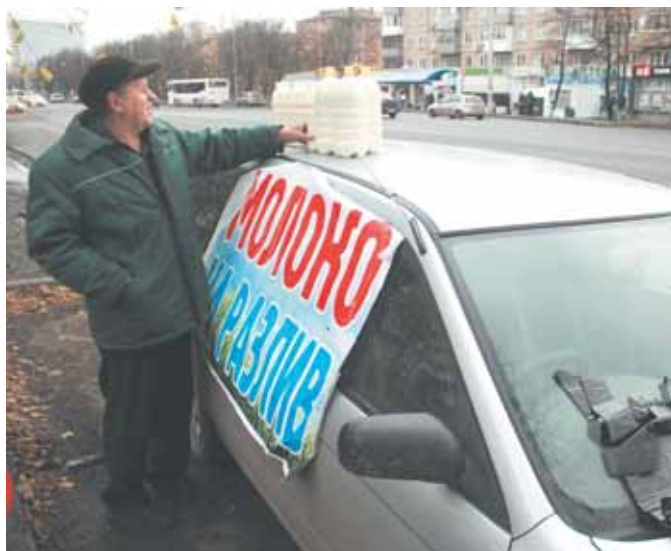
На фото: «молочный фургон» гарантии не даёт.

чае торговля должна быть цивилизованной.