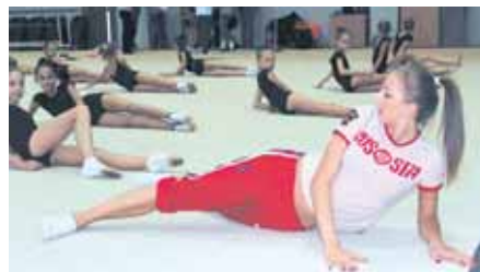
На фото: мастер-класс – разминка в ГЦС «Кузбасс».

– Нам нужно больше опыта, больше соревнова-