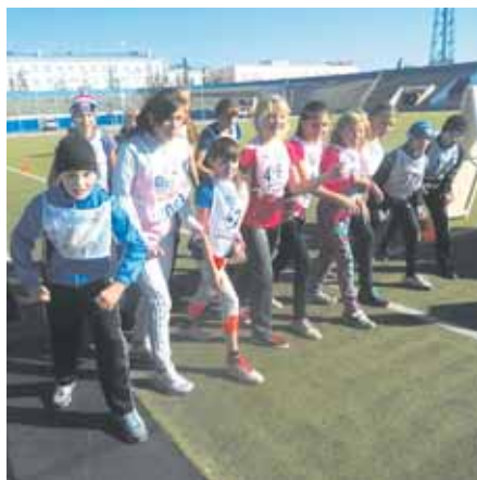
На фото: к забегу готовы, возраст не в счет.

«Нравится бегать... Для здоровья... Совершенствовать легкость бега... Любовь к бегу... Желание побеждать...», – такие фразы сегодня можно прочесть в строках буклета об истории клуба любителей бега «Сибиряк», который в ноябре текущего года отметит свое 30-летие.