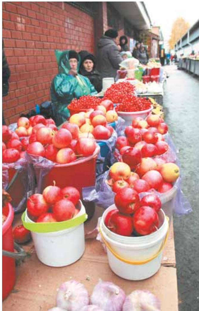
На фото: специально оборудованные торговые места. Правильное – всегда красиво.

Подходим к одной из «нарушительниц» – её прилавки с трикотажем стоят практически у пешеходного перехода. И если днём здесь ещё можно пройти спокойно, то в час пик они явно станут помехой потоку спешащих на остановку общественного транспорта людей.