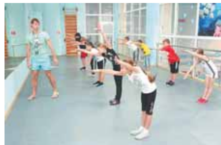
На фото: сухой заплыв.

Верный ответ прошлого конкурса – «Константин Ревя».