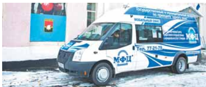
График работы мобильного офиса МФЦ в октябре

ление различных детских пособий: одновременный учёт; услуги комитета по жилищным вопросам: приватизация жилых помещений, включение молодых семей в реестр на очередь на жильё. Не менее популярно оформ-