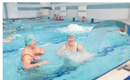
На фото: для здоровья, бодрости тела и духа.

кузбасские волейбольные турниры Сибирской железной дороги «Локоволей». Здесь не только удобно играть, но и болеть. Зрительские места – на втором уровне (выше площадки), и всё видно как на ладони.