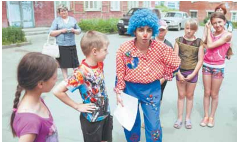
На фото: детский праздник в ЦРН «Творчество», июль 2014 г.