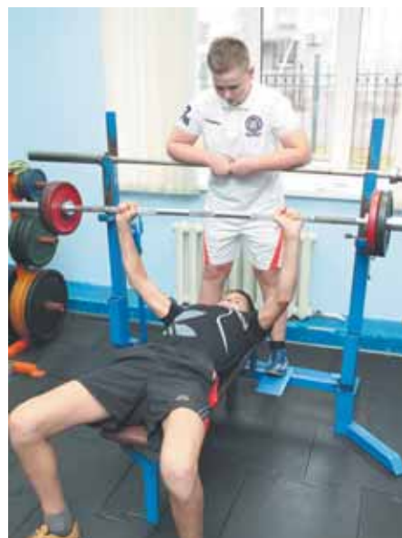
На фото: в зале сильных.

В зале светло, порядок (всё на своих местах), множество тренажёров. Причём есть такие, предназначение которых непосвящённый человек с первого взгляда может и не понять. А ещё есть особенная спокойная аура, образующаяся в обществе сильных, уверенных в себе людей. А ведь занимались во время нашего визита... дети и подростки. В немалой степени этому способствует внимательный и требовательный тренерский коллектив. Ну и те самые «металлические» стены, конечно. Хотя как выяснилось, и у этих ребят уже есть свои «драгметаллы», пусть пока только городские, областные, региональные... ☑