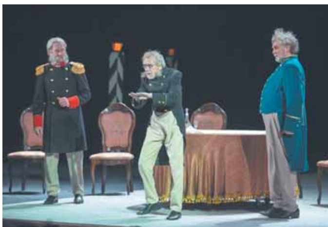
На фото: сцена из спектакля «Женитьба».

Губернатор, а также члены коллегии администрации области, работники культуры Кузбасса, творческая интеллигенция, заполнившая зал в этот особенный вечер, стоя приветствовали артистов и режиссёра-постановщика.