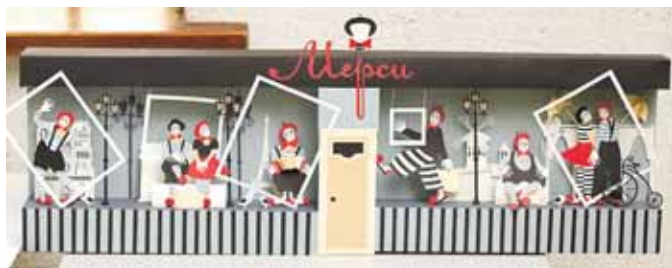
На фото: «Мерси» по-кемеровски.

Выставка с профориентационным уклоном. Организаторы надеются, что её обязательно посетят педагоги и воспитатели кемеровских художественных школ и школ искусств. Познакомиться с экспозицией могут все желающие. Вход бесплатный. Необходимо только захватить документ, удостоверяющий личность. Выставка будет работать до начала ноября. К