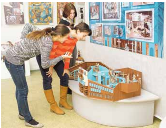
На фото: выставка работает до начала ноября.

В центре Кемерова – ювелирный магазин в георгианском стиле и багетная мастерская, как во Франции. На пустыре у «Лапландии» – выставка современной паровой техники. Такие проекты придумали начинающие кемеровские дизайнеры. О воплощении их в жизнь речи пока не идёт, но смелость замыслов впечатляет. Эти и другие работы студентов можно увидеть на выставке «Искусство учить», которая открылась в Кемеровском областном художественном колледже.