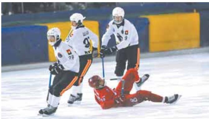
На фото: до финала Кубка мира из наших не дошёл никто, даже «Енисей».

6. В финальном этапе участвуют 6 команд. Сроки проведения – с 22 по 28 декабря.