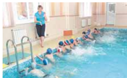
На фото: на занятиях в «лягушатнике».

скетболе? В последнее время в городских и областных соревнованиях всё более и более заметными становятся и футбольные команды ДЮСШ № 5. Когда мы зашли в светлый зал, как раз шла