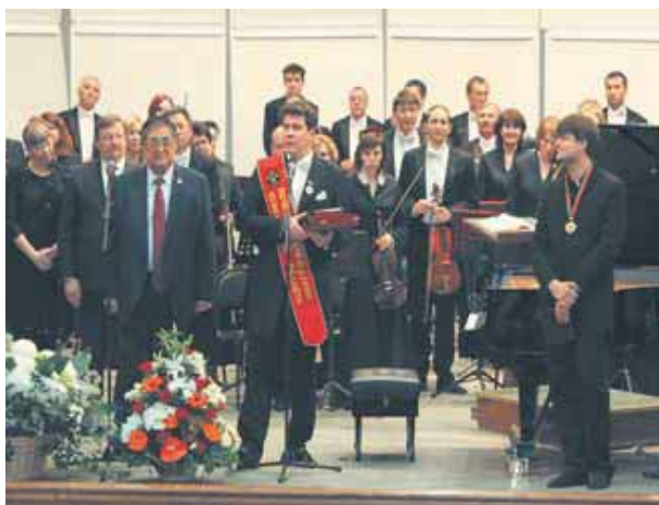
На фото: Аман Тулеев, Денис Мацуев и участники концерта.

Под гром аплодисментов, переходящий в овации, завершился в филармонии концерт «Денис Мацуев и его друзья», а сам прославленный маэстро, народный артист России, покинул в этот вечер сцену Почётным гражданином Кемеровской области.