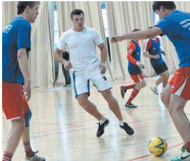
На фото: 21 октября, ГПС «Кузбасс», чемпион мира в матче «Бокс» – «Тележурналисты».

– Бой за титул чемпиона мира в моей карьере был впервые. Я боксировал не просто с чемпионом, а с человеком, который защищал пояс до боя со мной шесть раз. Кшиштоф был действующим чемпионом, на пике карьеры. Я счи-