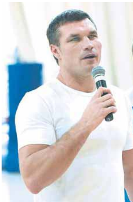
На фото: «Я готов сделать бой с чемпионами из других версий».

Александра Поветкина – все переживали. Каждый бы хотел, чтобы такие значимые бои проходили именно в нашей стране. Александр тогда проиграл, но наш бокс поднимается. У нас очень много талантливых ребят, которые буквально через одного могут претендовать на высокие титулы. Очень много мальчишек, которые равняются на меня. Для меня это очень большая ответственность, потому что меня много выбора – кроме как быть положительным примером в том, как нужно тренироваться, отдавать себя спорту, – нет. Право на ошибку у меня в этом деле отсутствует. □