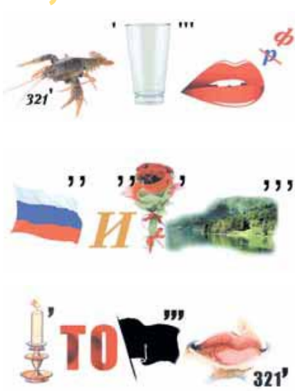
Автор-разработчик: Е.В. Гусарев, методист МБОУ ДО «Городской центр детского (юношеского) технического творчества в городе Кемерово».