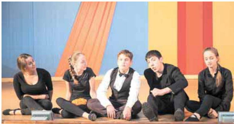
На фото: кемеровская студия на «Океанских подмостках».

Наряду с «Артеком» и «Орлёнком» дальневосточный «Океан» называли «лагерем всесоюзного значения». Сейчас «Океан» официально именуется Всероссийским детским центром. В октябре там прошла театральная смена, на которой побывали десять кемеровских школьников – участников театральной студии при гимназии № 71 «Радуга».