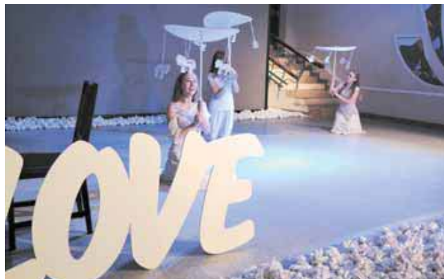
На фото: «Метель. Танец». Действие разворачивается в двух плоскостях – литературной и музыкально-пластической.

У Александра Гордоничего есть строчки, которые к пушкинской повести никакого отношения не имеют. Но именно они вспомнились после спектакля: «Пусть за любовью случайною, первую сразу последняя трянет любовь».