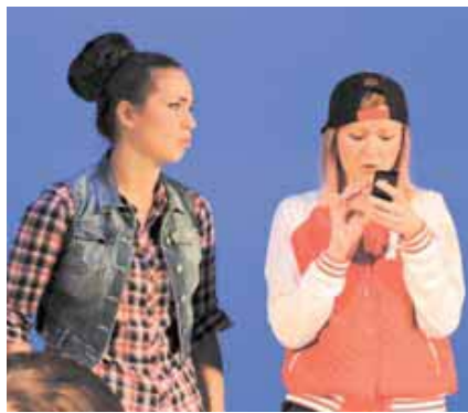
На фото: «Контакт». В пьесе большая часть реплик – цитаты из интернет-сообщений.

ет арию из итальянской оперы, в которой жрица просит помощи у богини. Выход Редько знаменует завершение первого, романтического периода жизни Маши.