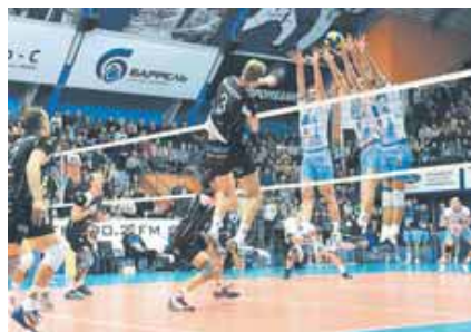
На фото: «чехол» на Нильссона.

Гости вытаскивали из своих тактических «амбаров» сильные подачу и блок. В результате мяч после атак Нильссона часто опускался