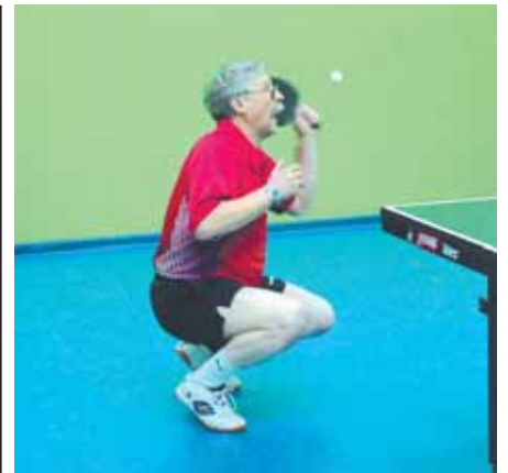
На фото: борьба за каждый мяч.