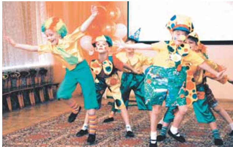
На фото: любимых педагогов поздравляют воспитанники детского сада.

Воспитанники детского сада регулярно становятся участниками творческих, спортивных и интеллектуальных конкурсов, фестивалей и олимпиад самого разного уровня, но главная награда для сотрудников «Малышка» – это счастливое и беззаботное детство его маленьких подопечных. □ Ольга ТИТОВИЧ.