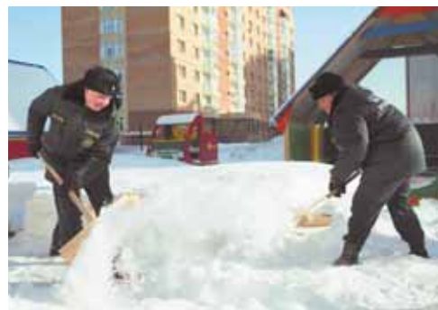
На фото: кто быстрее – два кадета или четыре девушки? 1:1. В соревнованиях по снегоборьбе участвовали кадетская школа МЧС и сотрудники теруправления Заводского района.