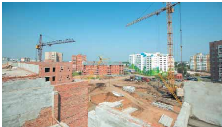
В 2014 году построено 283,4 тыс. кв. м жилья. Комплексная застройка – 157,1 тыс. кв. м жилья, точечная застройка – 61,1 тыс. кв. м, индивидуальное жилищное строительство – 65,5 тыс. кв. м.

В условиях спада экономики и нестабильности курса рубля для многих кемеровчан остаётся актуальным вопрос сохранения накопленных сбережений.