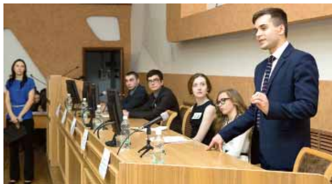
На фото: лидеры «партий» представляют свои программы.

Подобное мероприятие проводится в КемГУ впервые. И это не случайно, ведь страна начинает готовиться к целой серии выборов: в Госдуму в 2016 году, в городской и областной советы, на пост губернатора, президента РФ. Мы прекрасно понимаем, что не сможем увидеть результат такой работы прямо завтра. Но это вполне нормально для гуманитарной сферы вообще. А то, что ребята получают сегодня, подкрепят другими навыками и умениями завтра и послезавтра, я думаю, обязательно скажется на их дальнейшем поведении в выборной ситуации. □