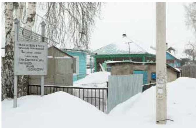
На фото: одна из улиц частного сектора Рудничного района Кемерово носит имя генерала Панфилова. К юбилею Победы памятная стела, открытая здесь 30 лет назад, преобразится.

Осенью 1941 года на подступах к Москве шли ожесточённые бои. Немцы упорно рвались к столице нашей Родины. Им преградила путь дивизия Панфилова. Неся огромные потери, она остановила врага.