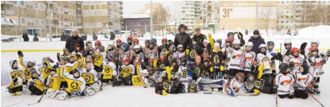
На фото: участники и организаторы турнира.