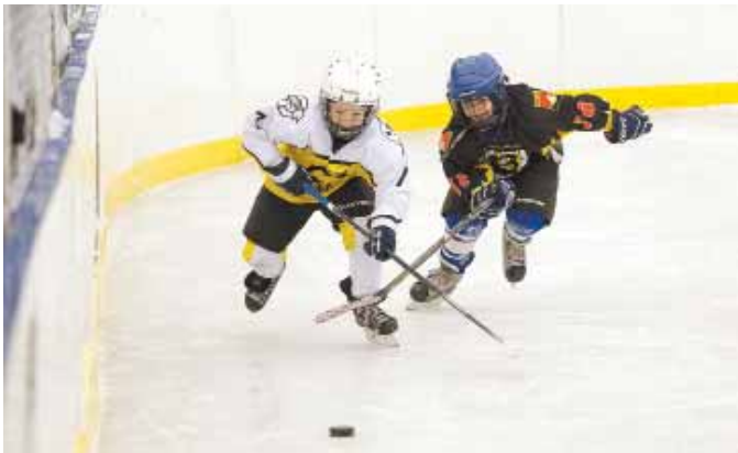
На фото: решающий матч – «Энергия» чуть лучше.