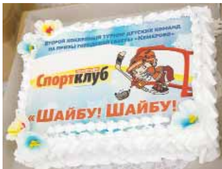
На фото: сладкий приз получили все команды.