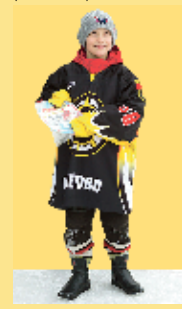
Герман Лиз («Восход-06»)