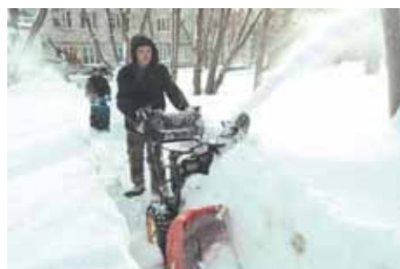
На фото: «Сквозь глубокие сугробы/Я дорожку проторю./Приходи, весна, скорее/На замену февралю». Субботник в детской многопрофильной больнице.

Напоминаем, что для этого надо только выйти с друзьями или коллегами на субботник в очередную «чистую пятницу» и прихватить с собой фотоаппарат. Фотографируйте ваш коллектив за работой и пришлите нам фотографию по электронному адресу news@kmtnews с пометкой «Наша «чистая пятница». Не забудьте подписать свою фотографию (название организации/компании, в каком районе трудитесь, приветствуется небольшая комментарий). В следующую пятницу мы опубликуем подборку наиболее веселых и позитивных фотографий на страницах газеты – в качестве морального напутствия всем горожанам перед предстоящими трудовыми десантами. Если вы заранее позвоните в редакцию газеты по телефону 58-08-07 , мы можем отправить к вам фотокорреспондента – при условии, что десант будет действительно творческим. Ждем ваших фотографий!