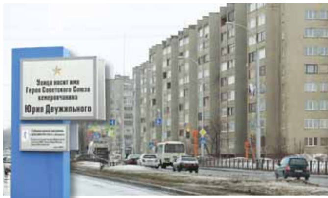
На фото: после смерти героев, так любивших друг друга, улицы их имени пересеклись в нашем городе.