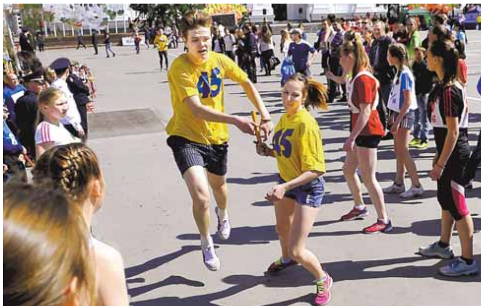
На фото: команда школы № 45, захватив лидерство на одиннадцатом этапе, так и донесла первой эстафетную палочку до самого финиша.

С первыми лучами утреннего солнца стало ясно, что погода 9 мая будет солнечная, тёплая, с безоблачным синим небом. Это добавило положительных эмоций перед парадом. После парада и прослушивания речи президента России на открытии московского парада в 14.00 состоялось торжественное открытие легкоатлетической эстафеты, которая установила новый рекорд по количеству команд за все 70 лет её проведения: их было 93, а участников в них – 1488.