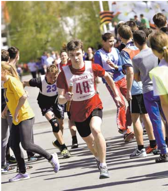
На фото: команда школы № 48 в этот раз не первая.

Текст: Борис ПРОСКУРИН.