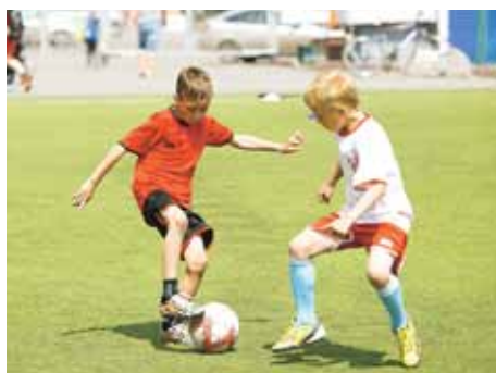
На фото: изыски техники от чемпионов – они превосходили соперников во всём.