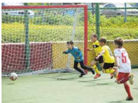
На фото: забьёт, не забьёт? Поймает, не поймает?