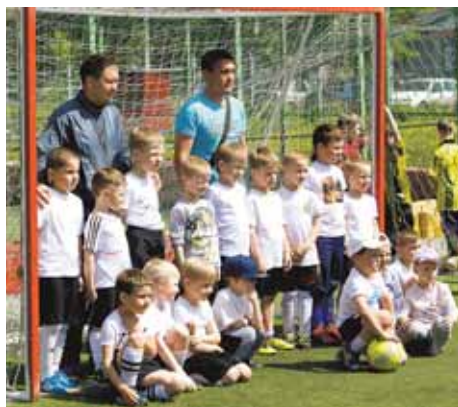
На фото: самые-самые... младшие – пятилетки из «Федерации-08-2» и их тренеры.

очень хорошо сыграли на хоккейном турнире детских команд в Ленинске-Кузнецком и победный настрой сохранили. Не всё у хоккеистов получалось на футбольном поле, но вот в упорстве, стойкости равных им не было. «Восход» навязывал соперникам силовую борьбу, а в ней хоккеистам проще. Так «перебороли» в первом матче «Федерацию-2008-1», едва не «забороли»