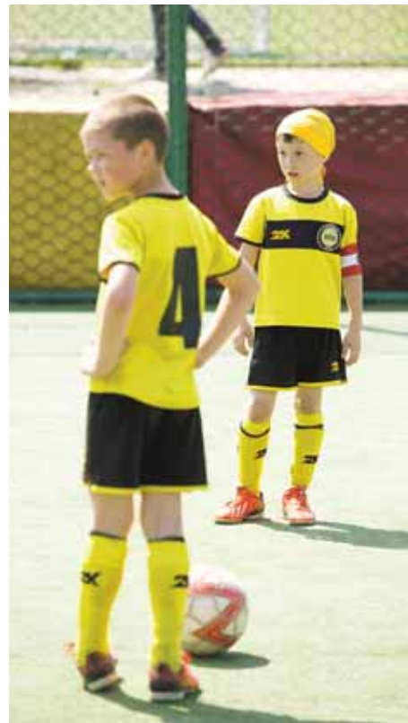
На фото: «Титан» – чемпион по стилю.