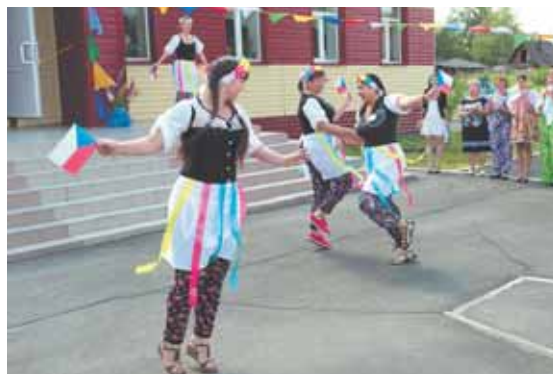
На фото: чешский танец из Ленинского района.

Центральный район областного центра придал фестивалю украинский колорит: девушки в нарядных рубашках и фартурках, веночках с атласными лентами радовали глаз. Национальный веночек плёлся из 12 цветков, каждый из которых – лекарь и оберег. Цвет ленты тоже имел определённое значение: белый символизировал чистоту, голубой – небо, зелёный – весну, красный – счастье и т. д. «Только