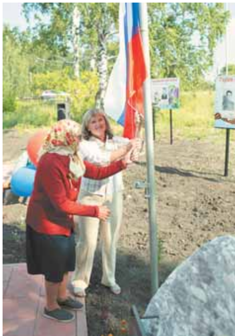
На фото: открывали сквер и уважаемые жители посёлка.