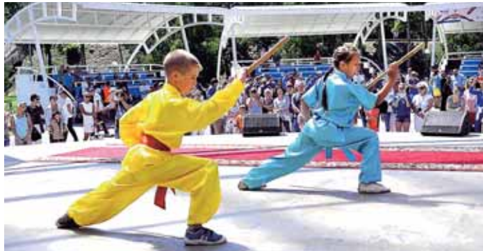
На фото: в центре внимания – ушу.

В эту субботу в парке им. Жукова можно было не только погулять, но и присмотреться к раз-