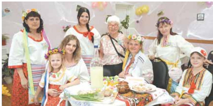
На фото: сотрудницы ЦРН «Юность» (ж.р. Ягуновский) представили украинцев.

В центре по работе с населением «Надежда» г. Кемерово в рамках проекта «Лето со смыслом-2015. Радуга счастья» состоялся фестиваль прикладного творчества славянских народов «Национальный узор».