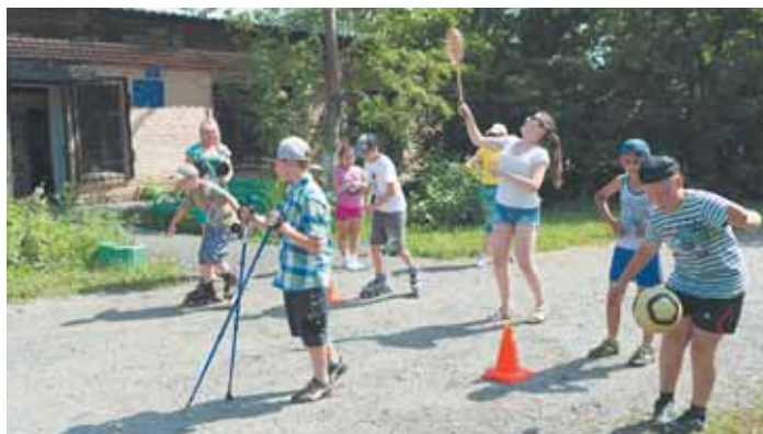
На фото: в ЦРН «Ударник» прокат спортивного инвентаря – бесплатный.