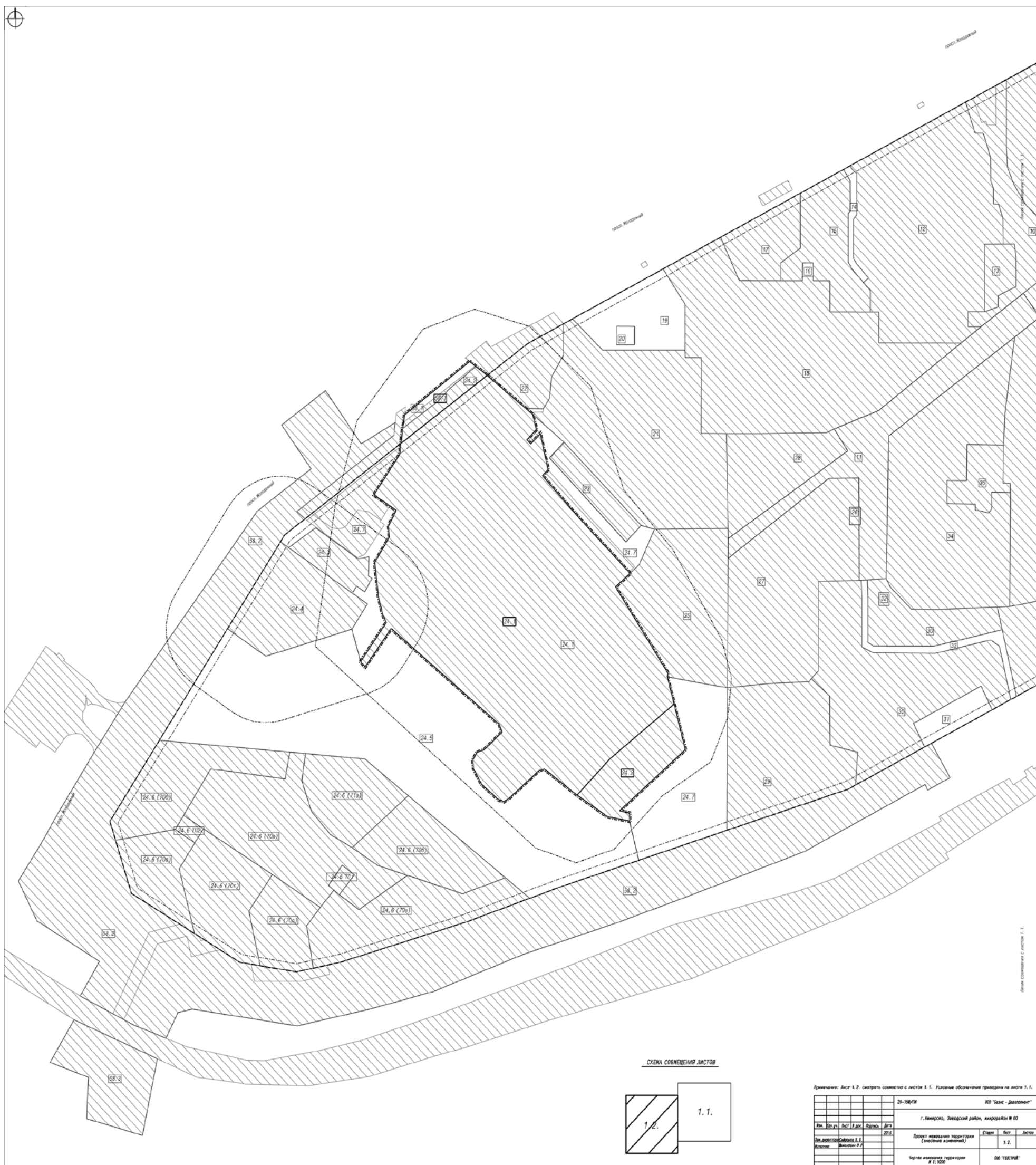
Приложение № 1 к постановлению администрации города Кемерово № 2293 от 28.09.2015