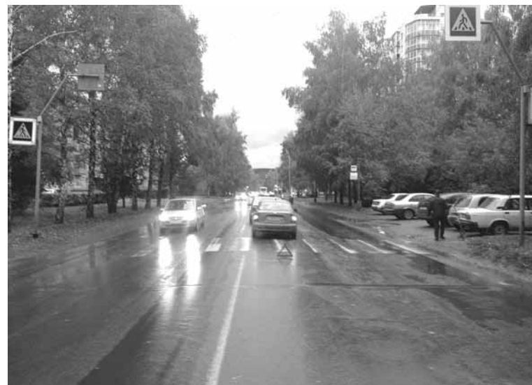
На фото: ДТП на проспекте Ленинградском.

В рамках операции «Юный пешеход», которая проходит в Кемерово с 21 по 30 сентября, сотрудники Кемеровской Госавтоинспекции усилили работу, направленную на профилактику ДТП с участием несовершеннолетних. При проведении бесед в образовательных учреждениях города инспекторы напоминают детям и подросткам о правилах безопасного поведения на проезжей части, а также о дополнительных мерах предосторожности на дороге, в том числе об использовании в темное время суток и в условиях недостаточной видимости световозвращающих элементов. На родительских собраниях они информируют взрослых о состоянии детского дорожно-транспортного трав-