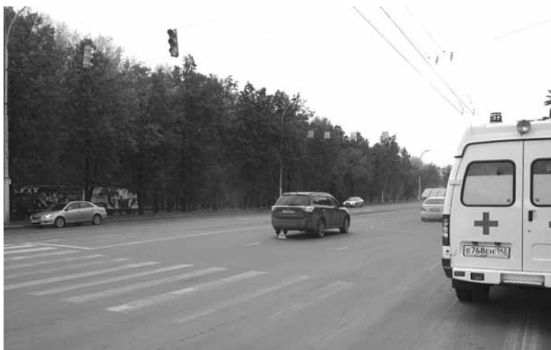
На фото: ДТП на проспекте Ленина.

За прошедшие выходные, 26 и 27 сентября, на территории города Кемерово произошло 4 ДТП, в результате которых 5 человек получили различные травмы. Среди пострадавших – один пешеход, девушка 16 лет.