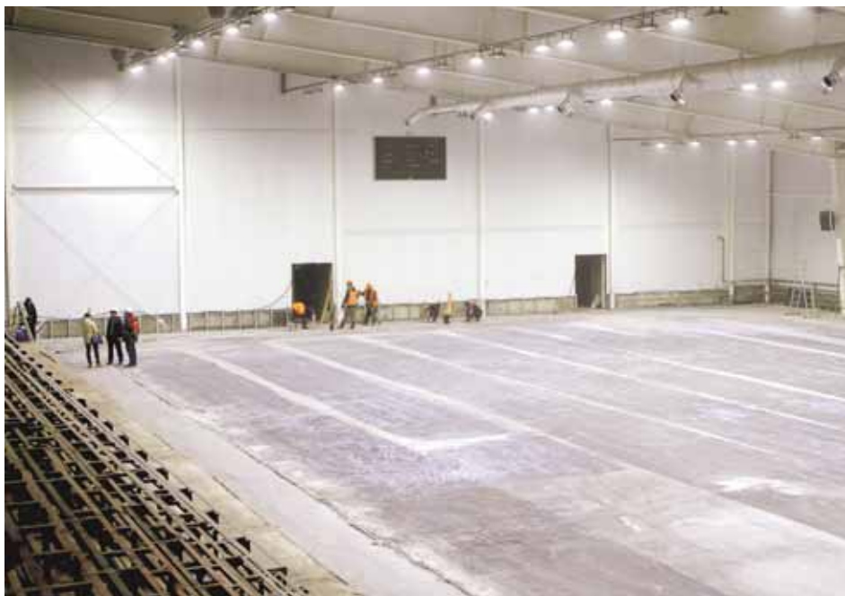
На фото: физкультурно-оздоровительный комплекс на ФПК.

По поручению губернатора Кемеровской области Амана Тулеева создан штаб для подготовки к главному кузбасскому празднику.