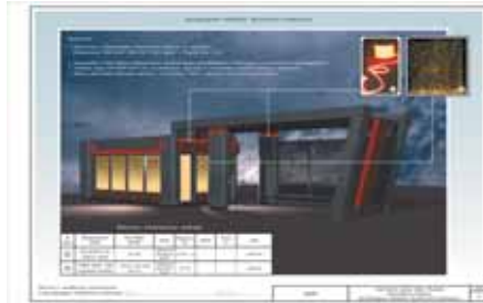
3. Образец архитектурного решения входной группы