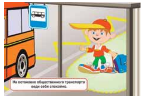
Рисунок 2. Помните, что вам доверяют.