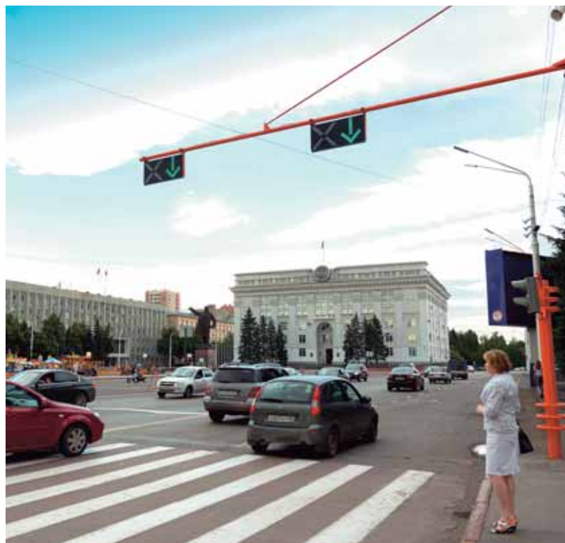
На фото: в июле этого года по инициативе губернатора области Амана Тулеева открыто двухстороннее движение по Советскому проспекту – через площадь Советов.

сти корректировки схемы движения транспорта на том или ином участке дорожной сети?