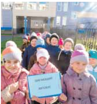
На фото: мы – жители Рудничного района.