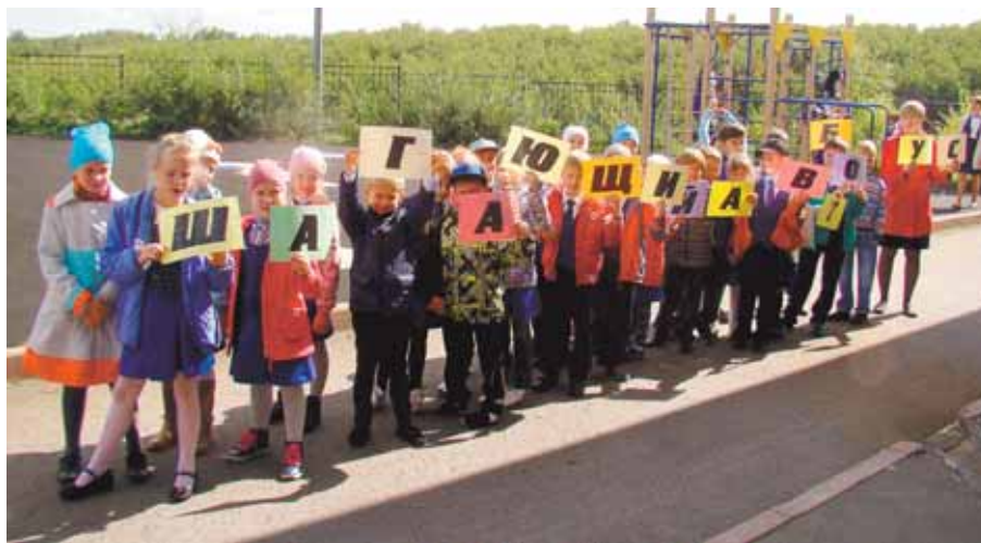
На фото: по дороге без опаски ходят в школу первоклашки.

Привет всем, кто хочет быть здоровым и веселым, жить без горя и без бед. Это девчонки и мальчишки с крутого правого берега Томи, из поэтично звучащего места «Радуга». Вернее, из Рудничного района, который состоит из жителей Лесной Поляны, жилых районов Кедровка, Промышленновский, Петровка, поселков шахты «Северная», «Бутовская», нового микрорайона «Серебряный бор» и Радуги.