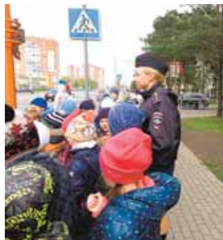
На фото: первоклассный пешеход знает все по переходу.