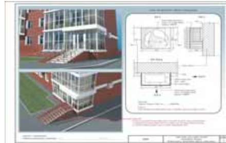
Приложение № 3 к Порядку согласования внешнего вида фасадов зданий, сооружений, нестационарных торговых объектов на территории города Кемерово

Администрация г. Кемерово Управление архитектуры и градостроительства