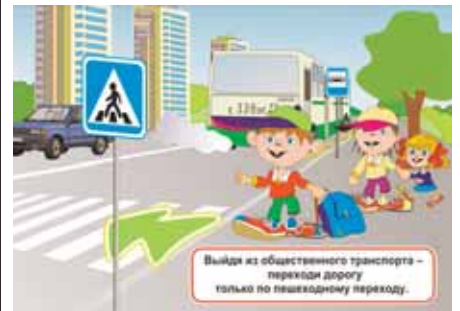
Рисунок 1. Закрепляем изученное на пешеходной прогулке «Шагающий автобус».