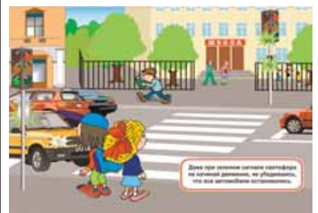
Рисунок 4. Помни об опасности!