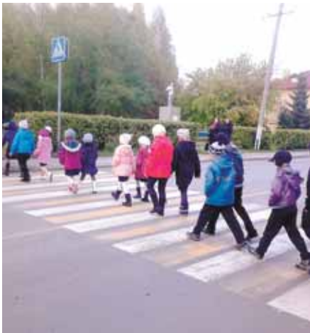
На фото: в поселке шахты «Бутовская» школьники знают все о безопасных маршрутах.

Наш район очень большой. Через него проходит много дорог, а по ним нескончаемым потоком движутся автомобили. Мы, активисты дорожной безопасности «Друзья патрульной службы» Рудничного района, докладываем, что уже два месяца в районе дружно проходит безопасный маршрут «Шагающего автобуса». Этот маршрут условный. На самом деле это экскурсии по опасным и безопасным участкам дорог. Эти экскурсии мы сопровождаем рассказом об особенностях перехода проезжей части в каждом конкретном случае, уделяя особое внимание безопасному маршруту. Целью таких