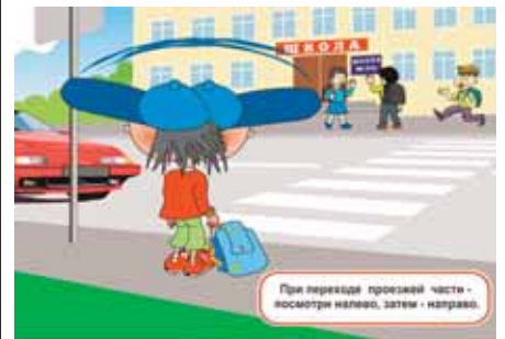
Рисунок 3. В поселке вы или в городе – о переходе помните!