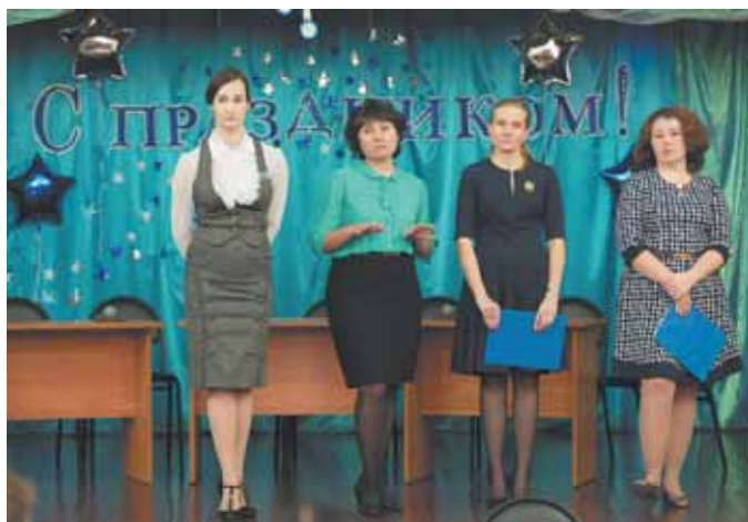
На фото: для удобства работы всех финалистов конкурса разделили на две группы.