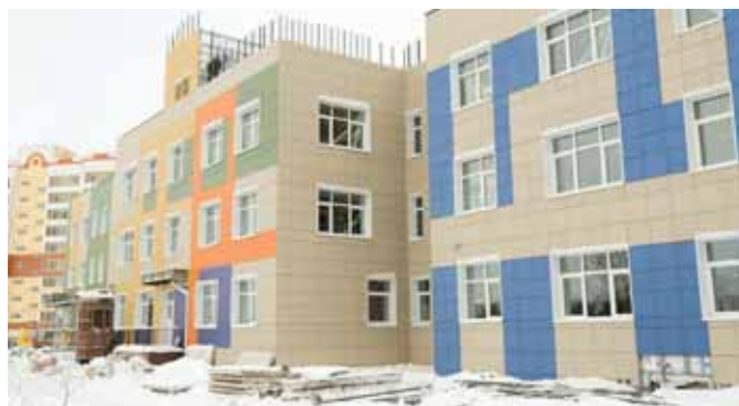
На фото: совсем скоро для малышей Рудничного района распахнут двери два новых детских сада: в микрорайоне № 12 и в микрорайоне № 13.