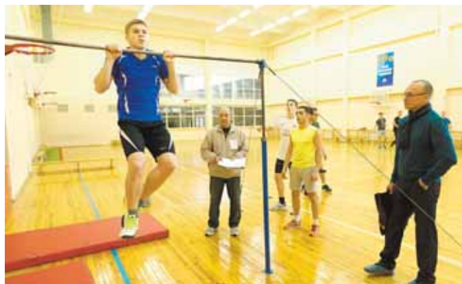
На фото: подтягивание на перекладине – обязательные испытания для юношей.

зии. – Считаю, что страна должна быть спортивной. Ведь многое зависит не только от учёбы и работы,