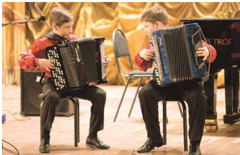
На фото: дуэт баянистов «Лад» покорила зрителей и жюри виртуозным исполнением.

Само название – «Кемеровская гармоника» – удачное, глубокое и многоплановое. Слово «гармоника» созвучно с термином