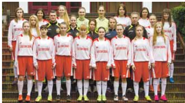
На фото: Сибирь – почти наполовину «Кузбасс».

Вряд ли стоило надеяться на первое место в групповом этапе, когда в соперницах футболистки КНДР – едва ли не главные претендентки на победу в «Кубанской весне-2016». Кореянки с севера Страны утренней свежести – традиционно одна из сильнейших команд мира именно в категории «молодёжь». Дают они «прикурить» абсолютно всем и на взрослом уровне. Футбольная Сибирь, несмотря на старание, также не устояла – 1:5. А вот в матче со сборной Эстонии наша команда не смогла воплотить в голы уже своё игровое преимущество – 0:0. В последнем матче первого этапа, чтобы пробиться в полуфинал, была необходима победа над сборной Краснодарского края. И она