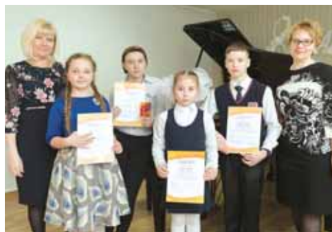
На фото: юные таланты со своими педагогами.

Для многих конкурсантов «Кемеровская гармоника» за годы существования стала отправной точкой в судьбе, помогла определиться в выборе пути творческого и профессионального. Пройдя «боевое крещение» фестиваля-конкурса, его лауреаты и дипломанты становятся победителями всероссийских и международных престижных смотров музыкального мастерства. ■