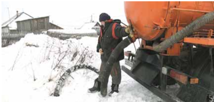
На фото: в составе службы три аварийно-восстановительные бригады, бригада канализационщиков и бригада электриков. На объектах заняты слесари по ремонту, газосварщики и специалисты по обслуживанию канализационных сетей.

На протяжении многих лет задачи, которые ставятся перед службой, выполняются на совесть. Секрет прост: каждый день в эпицентре коммуналь-