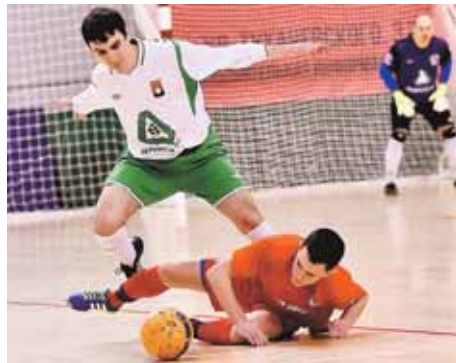
На фото: одним поражением «Перекрёсток» с высокого полёта не сошёл.

Нолик в графе «Поражения» хоть и почётен, но очень тяжёл. Вряд ли стоит тащить его до конца пути: бонус за финиш без проигрышей не предусмотрен. Главное, чтобы «привал-поражение» не затянулся. Ближайшим воскресным утром в ГЦС важный матч с барнаульским «Автоцентром». ☐