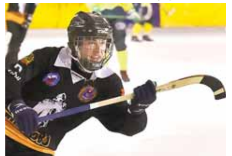
На фото: один из лучших бомбардиров юниорского первенства России начал финальный турнир с того, что отгузил «Воднику» шесть (!) голов.

В прошлую субботу в Кемерове стартовал прелюбопытный в футуристическом плане турнир – финал первенства России по хоккею с мячом среди юниоров (до 19 лет). Ведь уже следующей осенью значительная часть его участников будет де-факто считаться взрослыми хоккеистами.