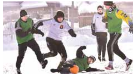
На фото: «Азот» зацепился за «бронзу», разгромил «СДЮСШОР-1».

Как природная зима ещё держит оборону не растаявшим кое-где на газонах снегом и льдом, так и городской футбольный зимний сезон ещё не совсем завершился; но никто не сомневается, что зима в общем-то закончилась, как и зимний сезон.