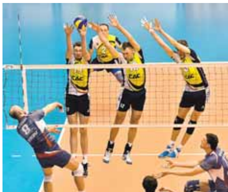
На фото: многое в матче решило противостояние живой легенды мирового волейбола Сергея Тетюхина (№ 8) и Максима Жигалова (№ 17) – результат его виден даже на снимке.