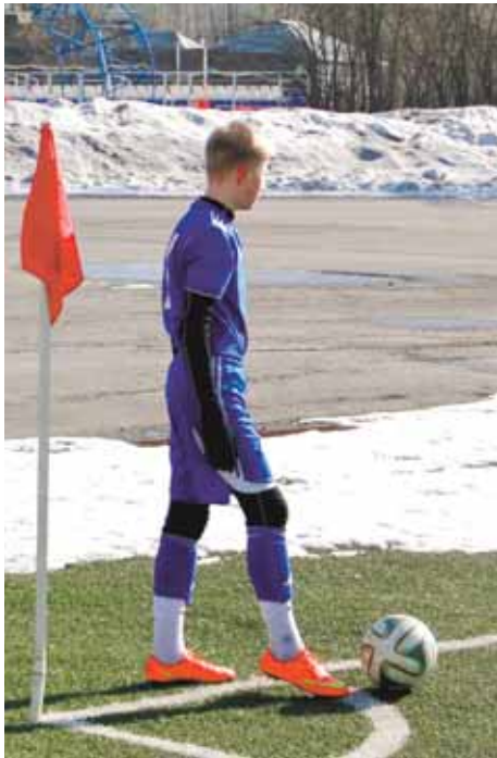
На фото: большинство матчей турнира принял уже готовый к летним футбольным баталиям стадион «Шахтёр».