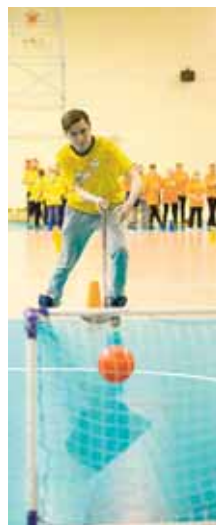
На фото: на «Хоккее».

26 апреля гостеприимный кедровский спорткомплекс «Горняк» принял у себя не совсем обычную спортивную эстафету, посвящённую празднованию Дню шахтёра.