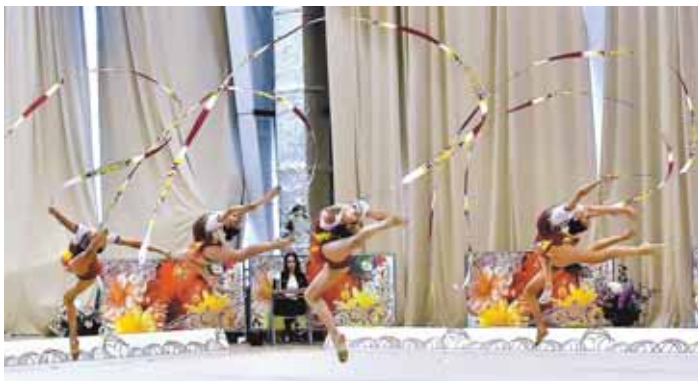
На фото: выступление команды Кемеровской области (кандидаты в мастера спорта).

Текст: Сергей КЛАДОВ.