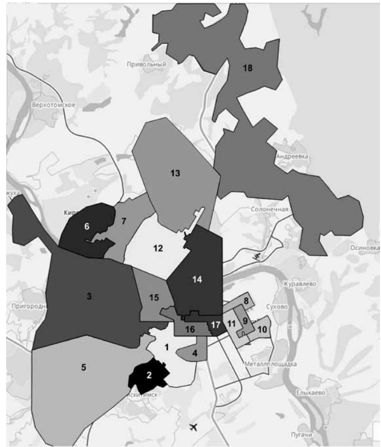
Схема одномандатных избирательных округов (графическое изображение)

Приложение № 2 к решению Кемеровского городского Совета народных депутатов пятого созыва № 491 от 29.04.2016 (семьдесят четвертое заседание)