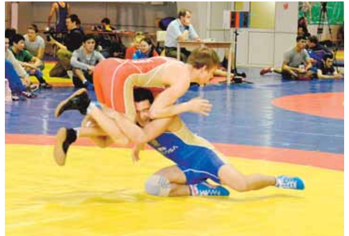
На фото: прочь из захвата!

В ближайших матчах играют: 20 мая (пятница). «Енисей-М» – «СДЮСШОР-Кемерово», «Распадская» – «Зенит», «Новокузнецк» – «Чита-М», «Рассвет-Реставрация» – «Сибирь-М». 22 мая (воскресенье). «Рассвет-Реставрация» – «СДЮСШОР-Кемерово», «Распадская» – «Чита-М», «Новокузнецк» – «Зенит», «Енисей-М» – «Сибирь-М». 24 мая (вторник). «Шахтёр» – «Зенит».