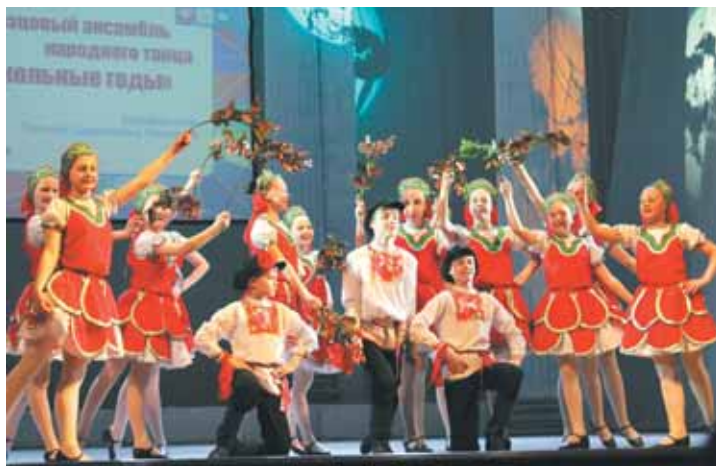
На фото: ансамбль народного танца «Школьные годы».