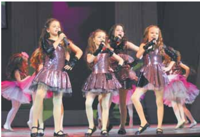
На фото: ансамбль эстрадной песни «Baby Sound».