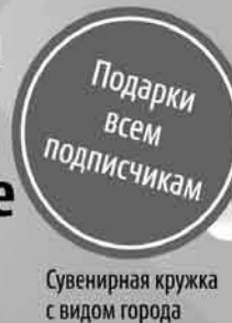
Сувенирная кружка с видом города

Редакционная подписка на II полугодие 2016 года